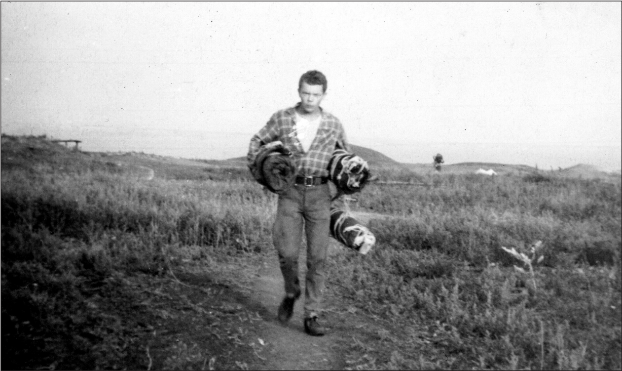
Ольвія, 1980-ті рр.

си: археологія; археологія України; антична колонізація Північного Причорномор'я; номади Північно-Західного Причорномор'я доби середньовіччя. Багато сезонів він — незмінний керівник археологічних практик студентів історичного факультету на багатьох археологічних об'єктах Миколаївської обл.: Ольвія (Очаківський р-н); Дикий Сад (м. Миколаїв); о. Березань (Очаківський р-н), Очаків (м. Очаків), Велика Корениха I—III (м. Миколаїв); Сіверсів маяк (м. Миколаїв); Вікторівка I (Березанський р-н); замок «Леріче» (Очаківський р-н); курганні могильники (Первомайський, Жовтневий, Миколаївський, Очаківський, Новоодеський, Вознесенський р-ни) та ін. Він працював з плеядою визнаних українських археологів: Л.М. Славін, В.В. Лапін, А.В. Бураков, С.Д. Крижицький, А.С. Русяєва, Н.О. Лейпунська, В.В. Крапівіна, В.В. Крутілов, С.М. Беляєва, Ю.С. Гребенніков, О.В. Симоненко, К.В. Горбенко, І.О. Снитко.