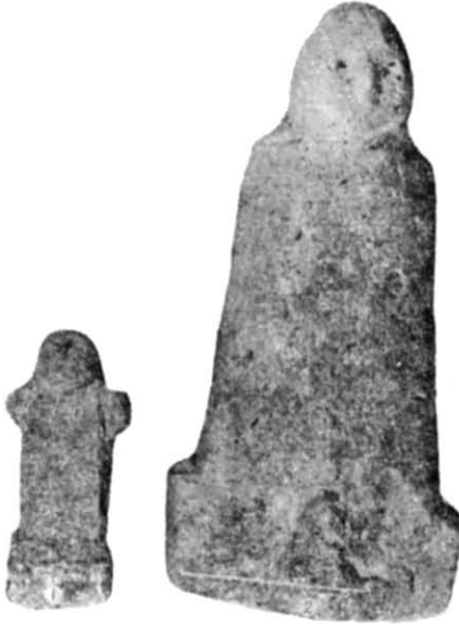
Рис. 4. Кам'яна герма (1) і чоловіча фігурка з каменю (2).

У різних місцях розкопу траплялись уламки черепиці, яка була покрівлею будинка. Поряд з червоноглиняною херсонеською черепицею знайдена сінопська з різними клеймами. На одному уламку добре збереглося клеймо ΙΣΤΙΑΙΟΥ|ΑΣΤΥΝΟΜΟΥ|ΝΕΥΜΗΝΙΟΥ, яке належить до I групи сінопських клейм, за Б. М. Граковим, і датується, за І. Б. Брашинським, 360—320 рр., до н. е., а також емблема — орел, що роздирає дельфіна 9 . На другому уламку черепиці є початкові літери рядків: ΙΣΟΚΡΙΤΟΥ|ΑΣΤΥΝΟΜΟΥ|ΕΡΜΙΑΣΟΥ. На третьому — клеймо ΙΣΟΚΡΙΤΟΥ|ΑΣΤΥΝΟΜΟΥ|ΝΟΥΜΕΝΙΟΥ. Останні два (II група, за Б. М. Граковим) датуються 320—270 рр. На четвертому (II група) легенда збереглася гірше — ΕΠΙΕΛΠΟΥ|ΑΣΤΥΝΟΜΟΥ|ΤΕΥΦΡΑΣΟΥ. Емблема — бик,