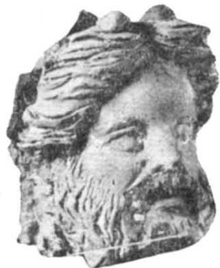
Рис. 3. Скульптура Діоніса.

Серед цих предметів привертає увагу теракотова голова Діоніса (уламок фігури). Він зображений бородатим, у вінку з листя та ягід хмелю; рот напіврозкритий (рис. 3). Іконографічно такі зображення ототожнюються з індійським Діонісом. С. А. Жебелєв відносив їх до типу ΔΙΟΝΣΟΥΟΙΝΩ ΜΕΝΟΥ (Діоніс напідпитку), поширеного в елліністичному мистецтві, тоді як за пізньоелліністичного часу перевага віддається юному Діонісу 4 . Культ цього божества був надто популярним у Північному Причорномор'ї, особливо за доби еллінізму, у період розвитку виноградарства та виноробства. Схожі зображення його відомі на Боспорі і в Херсонесі, де у III—II ст. до н. е. була майстерня коропласта 5 . До її виробів, можливо, належав і описаний вище Діоніс.