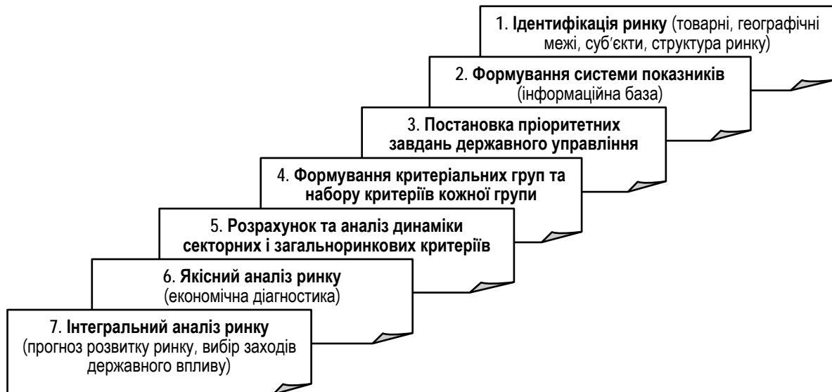
Рис. 2. Послідовність етапів критеріальної оцінки продовольчого ринку

Розроблена методика критеріальної оцінки державних продовольчих ринків включає сім етапів (рис. 2). Кожний етап вирішує певне проміжне завдання, сукупність яких орієнтована на досягнення головної мети МКО. Розглянемо виділені етапи критеріальної оцінки продовольчого ринку більш детально.