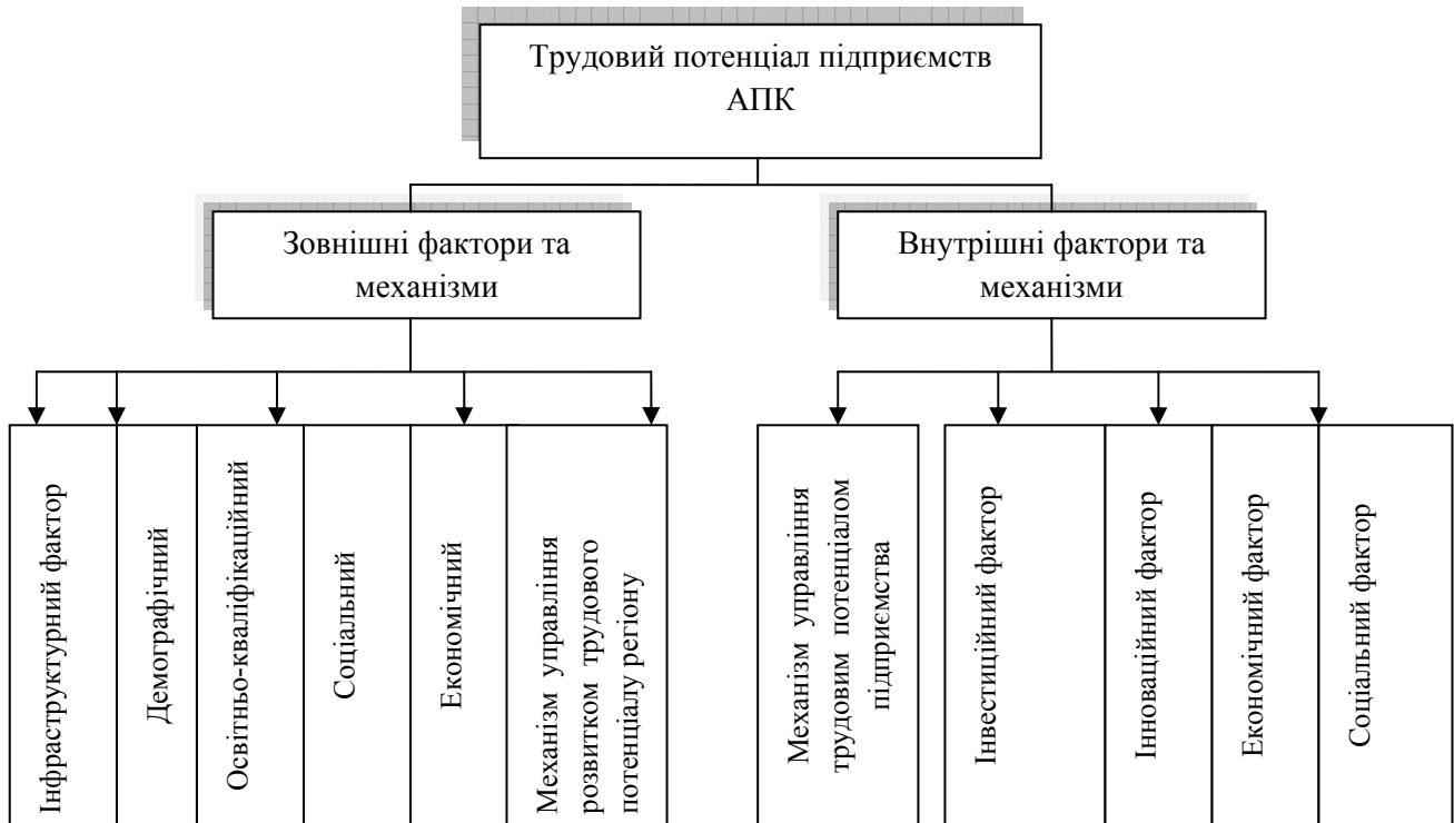
Рис. 2. Зовнішні та внутрішні фактори і механізми формування та розвитку трудового потенціалу підприємств АПК

На рис. 2 показані як зовнішні, так і внутрішні фактори, активізація яких має забезпечити перелом дуже небезпечних негативних тенденцій у сфері забезпечення підприємств АПК робочою силою.