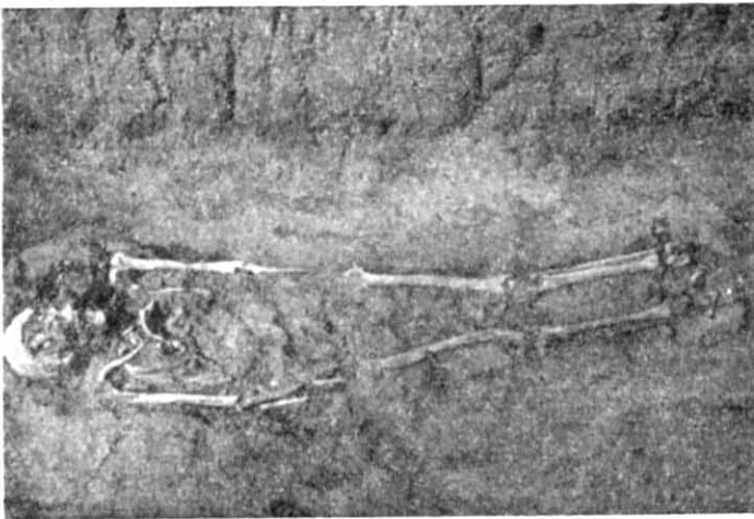
Рис. 2. Поховання кочовика.