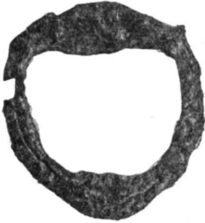
Рис. 3. Стрімено з поховання.

Відкрите поховання відносимо до пізньокочівницького типу. Подібні до нього, але впускні, виявлені неподалік під час розкопок курганів у 1954 р. 2