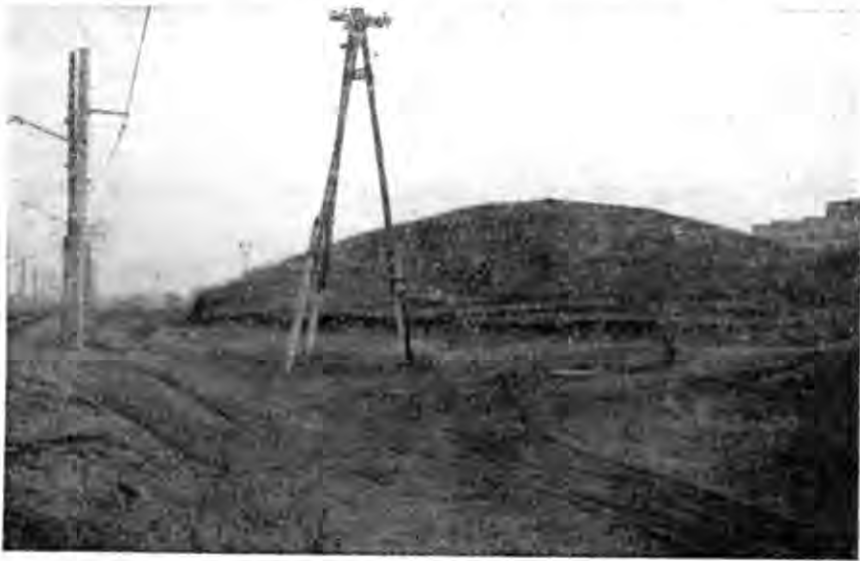
Рис. 1. Товста Могила. Вигляд з південного заходу.