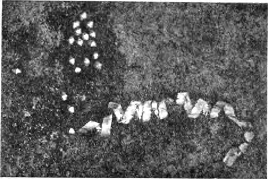
Рис. 4. Золоті намистини та стрічка від бунчука.

Дромос, що вів із вхідної ями до склепу, залишився неперевіреним грабіжниками. Перед входом до підземелля головою на південь лежав кістяк слуги. За ним на долівці дромоса виявлено бронзові лутерій та світильник, біля південної стінки стояла велика амфора з трьома ручками. Коло самого спуску в склеп знайдено залізний меч з обкладеними