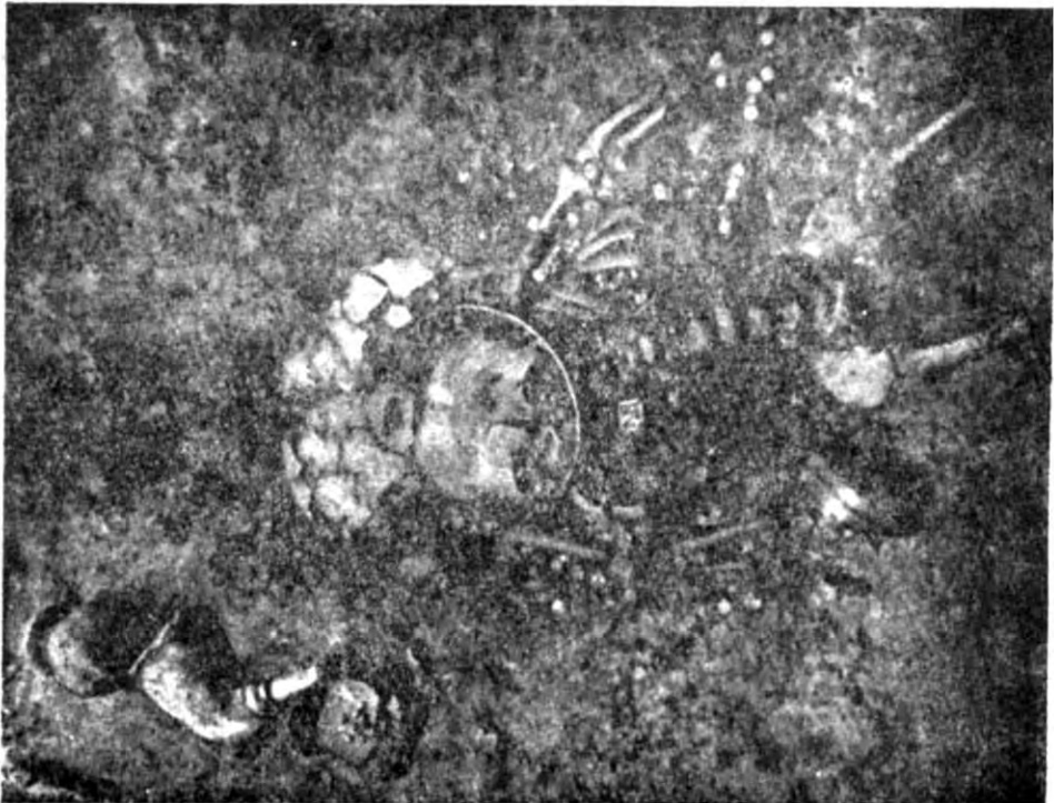
Рис. 11. Поховання дитини.