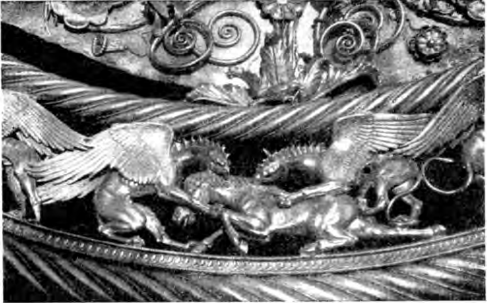
Рис. 6. Деталь пекторалі.

Ліворуч і праворуч від цієї сцени стоять свійські тварини скіфів з малятами: кінь, корова, вівця, коза. В правій частині композиції юний скіф, присівши напочіпки, в місцеву посудину доїть вівцю (рис. 7), в лі-