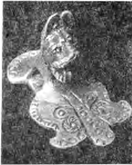
Рис. 3. Золоте нанісся.

Два срібних набори північної могили дуже поганої збереженості. Одну з вуздечок було кинуте на череп коня, другу одягнуто на нього.