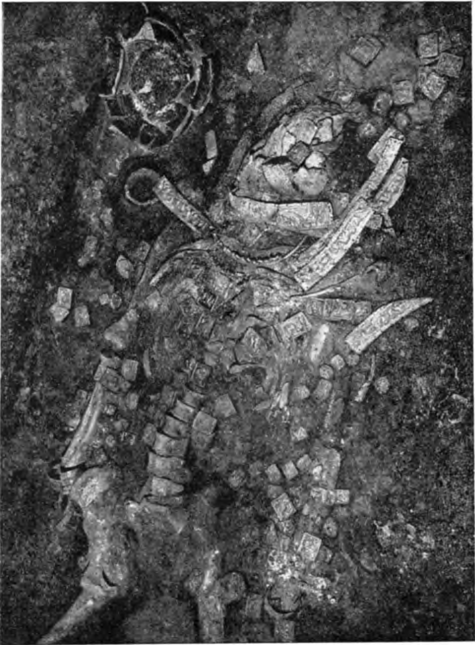
Рис. 9. Верхня частина поховання жінки.

зап'ястях крім трьох широких рубчастих браслетів — перев'язі із наміста, на пальцях — 11 перснів з плоскими щитками та дротяна обручка, під лівою лопаткою — бронзове люстерко. Черевички на ногах було обшито бляшками в вигляді п'яти з'єднаних кіл.