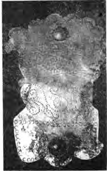
Рис. 2. Золотий нащічник.

В південній могилі виявлено три однакові золоті вуздечкові набори, що склалися з шести малих та великих круглих блях з срібною шпичкою посередині і такою ж петлею на зворотному боці, двох фігурних нащічників із зображенням у верхній частині голубів (рис. 2), масивного литого нанісся у вигляді голівки фантастичної істоти з розкритою пащею (рис. 3) та двох ворворок. Зображення голубів на нащічники нанесено від руки. Тіло деяких з них переходить у закручений змієвидний чи рибацький хвіст. Всі вудила і псалії залізні. На кінцях вудил — шипи для строгого управління. Псалії великі С-подібні. Повід до вудил кріпився за допомогою залізних пряжок у вигляді з'єднаних в одній пло-