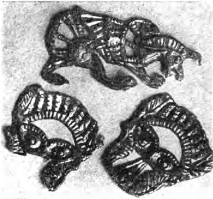
Рис. 5. Золоті прикраси горита.

Пектораль являє собою неповторний, геніальний витвір скіфо-античного золотарства. Вага речі 1150 грамів, діаметр 30 см (вклейка 1).