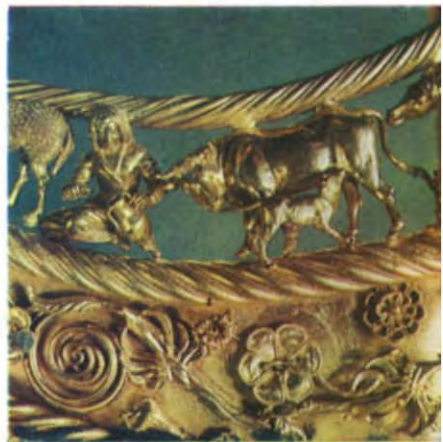
Золота пектораль з Товстої могили (IV—III ст. до н. е.) та сцени з життя скіфів (деталі пекторалі).