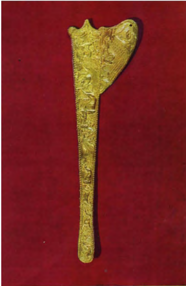
Золоте окуття піхов меча. Товста могила (IV—III ст. до н. е.).