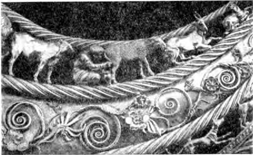
Рис. 7. Деталь пекторалі.

В східному кутку ями знаходився вхід до поховальної камери, в якій лежав кістяк дівчинки-служниці. Підземелля складалося із дромоса довжиною 2,3 м, шириною 0,8-1,1 м і висотою 0,8 м і перпендикулярного до нього овального в плані склепу розмірами 1,6 \times 1 \times 0,95 м. Скелет