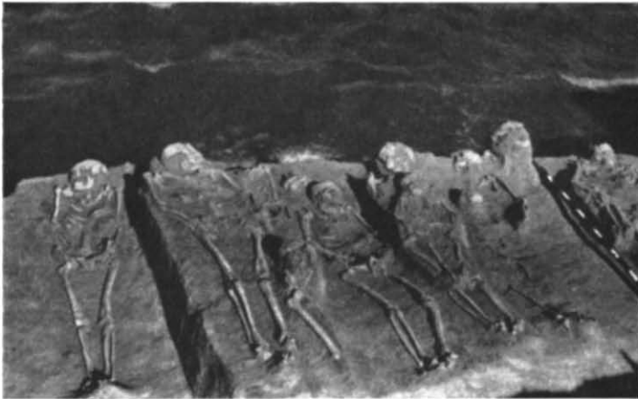
Рис. 1. Вид на частину розкопаних поховань Капулівського могильника.

Зараз, після піднесення рівня дніпровських вод, важко уявити собі топографію місцезположення могильника. Певно, це був край високого