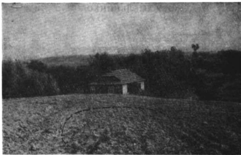
Рис. 1. Пізньопалеолітичне місцезнаходження в с. Добротів.

Влітку 1964 р. між р. Слобушниця та с. Добротів Ланчинського району Івано-Франківської області на мисовидному виступі другої надлугової тераси р. Прут було знайдено десять пізньопалеолітичних виробів, виготовлених з темно-сірого кременю. Виявлені вони на поверхні