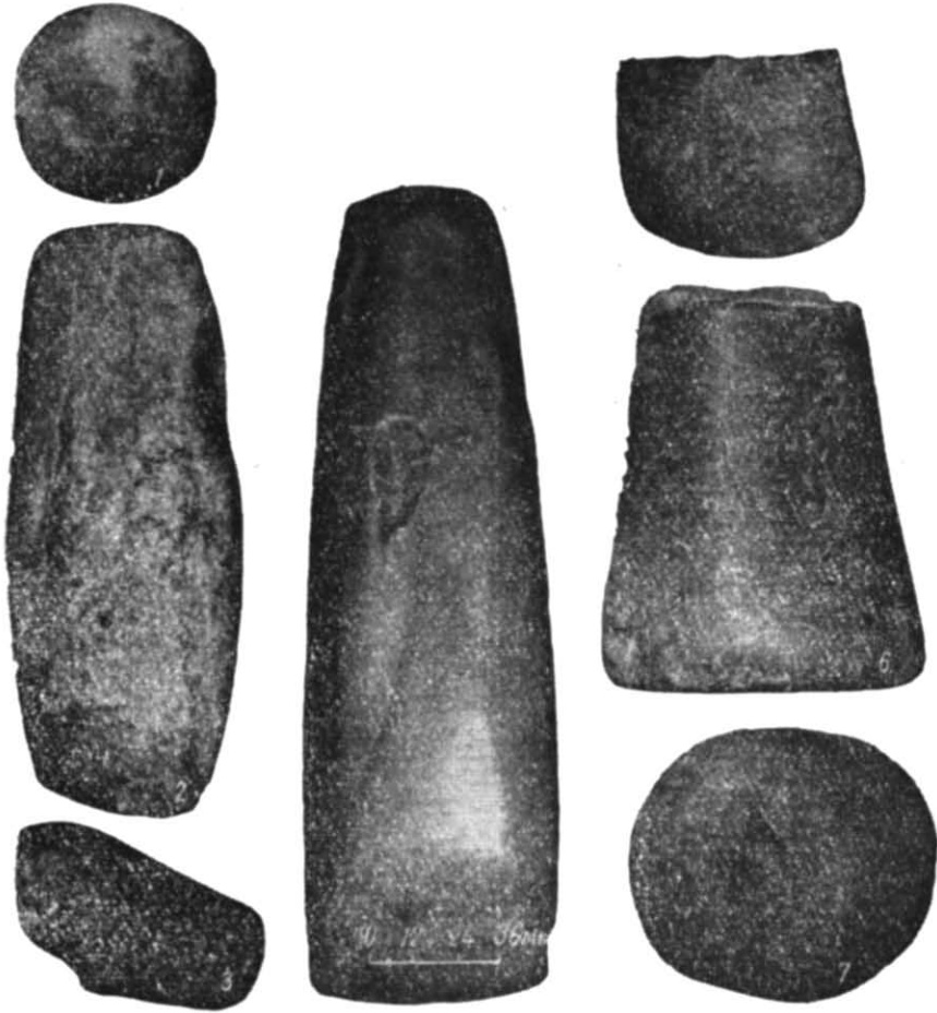
Рис. 2. Кам'яні знаряддя з басейну річок Інгулець та Саксагань.

Пест-товкач (рис. 2, б) правильної конусовидної форми. Довжина його 9 см, діаметр робочої частини 7 см, протилежного кінця — 50 см, вага 788,8 г. Верхній кінець товкача нерівний (можливо, збитий ще в минулому), але пригладжений, затягнутий вапняною корочкою. З боків товкач старанно заполірований. Про його використання свідчать вищерблення на нижній, теж пришліфованій робочій поверхні. Знаряддя виготовлено з сірувато-зеленого середньозернистого (0,5—1,0 мм) амфіболіту гетерогранобластової структури. Крім зерен плагіоклазу та