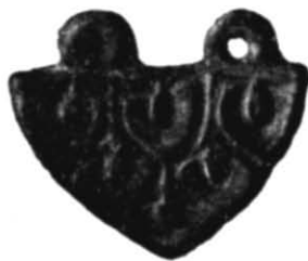
Рис. 5. Зображення «водної лілії» на накладці з Салтівського могильника.

Точне місце знахідки розглядуваної пам'ятки невідомо.