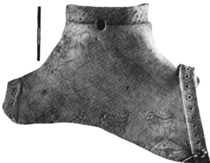
Рис. 1. Роговий виріб з гравіровкою.

В колекції Керченського державного історико-археологічного музею серед безпаспортних речей, придбаних ще до Великої Жовтневої соціалістичної революції, знаходиться уламок верхньої частини кістяного виробу, вирізаного з рогу старого оленя 1 . Виріб має еліпсоподібне в плані устя, яке переходить у бічні виступи з отворами (рис. 1).