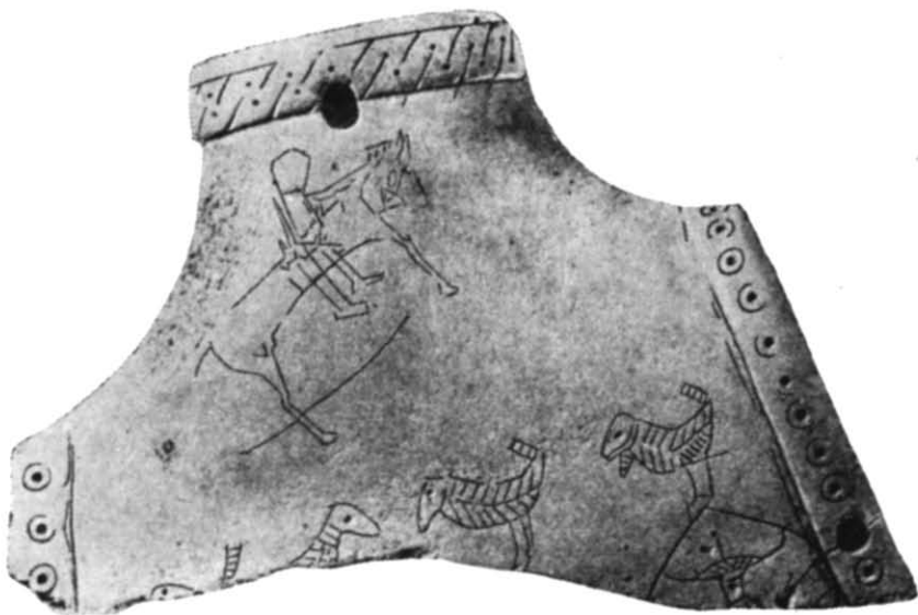
Рис. 2. Прорисовка гравірувальних зображень на роговому виробі.

Край устя закінчується потовщенням шириною 7 мм, прикрашеним крапками та навскісними штрихами, що ритмічно чергуються і утворюють враження крученого паска. Бокові отвори облямовані рельєфними стрічками шириною 8—10 мм з циркульним орнаментом. У нижній частині були зображені великі дуже стилізовані квітки, виконані ретельно і чітко гострим інструментом (рис. 2).