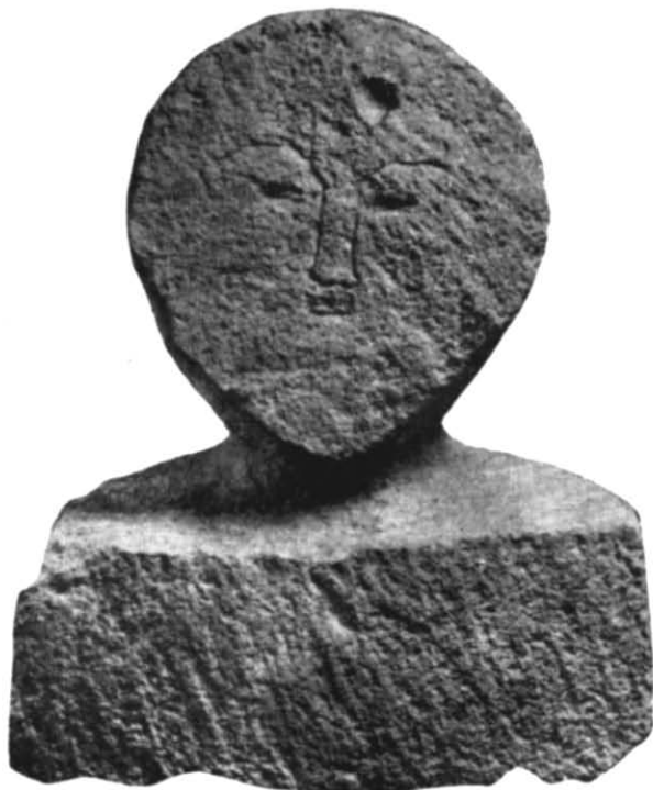
Рис. 4. Стела з південно-східного некрополя Херсонеса.

Антропоморфні надгробки Херсонеса становлять окрему групу серед північнопричорноморських пам'яток подібного роду. Останніми дослідженнями А. О. Щепинського 12 поставлене питання про послідовність у розвитку цього типу, який веде свій початок, найімовірніше, від