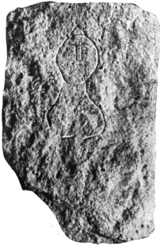
Рис. 3. Плита з розкопок 1960 р. в Херсонесі.

неса, причому можливо, що тут справила вплив поява в перші століття н. е. в надгробній скульптурі міста портретного погруддя померлих. Надгробок з цитаделі, на наш погляд, потрібно поставити пізніше вищеописаних зображень, але дещо раніше херсонеських надгробків місцевої роботи кінця II — початку III ст. н. е. з портретним зображен-