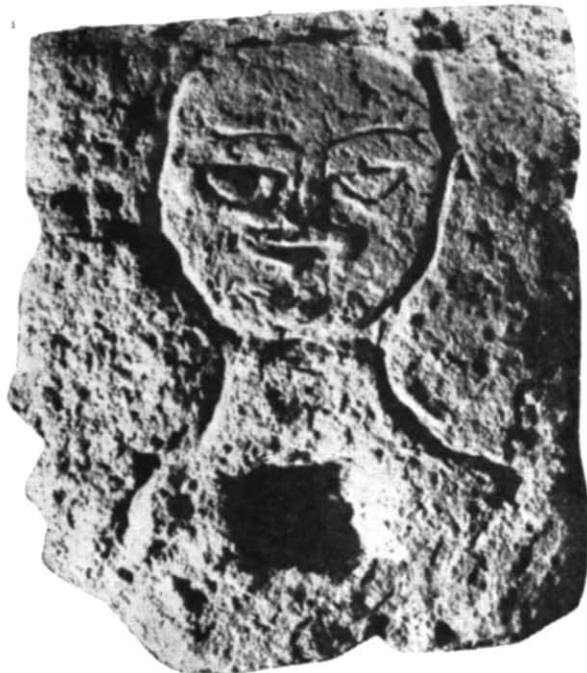
Рис. 1. Стела з розкопок 1958 р. в Херсонесі.

Незважаючи на загальну велику подібність, це зображення деякими деталями відрізняється від першого. Овал обличчя дещо загострений донизу. Мигдалеподібні вузькі очі посаджені досить широко. В