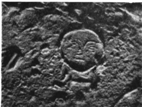
Рис. 2. Зображення на облицьовальному камені з розкопок 1960 р. в Херсонесі.

другого будівельного періоду була розібрана, очевидно, в тій частині, яка здіймалася над землею. Малюнок знаходився в п'ятому ряду облицьовки. Десять шарів II—I ст. до н. е. біля 17-ї куртини становлять 1,4 м товщини 6 . Біля 20-ї куртини другого будівельного періоду в тому місці, де нанесений малюнок, шари накопичувались, мабуть, скоріше, бо тут материкова скеля утворює глибоку западину. Виходячи з цього,