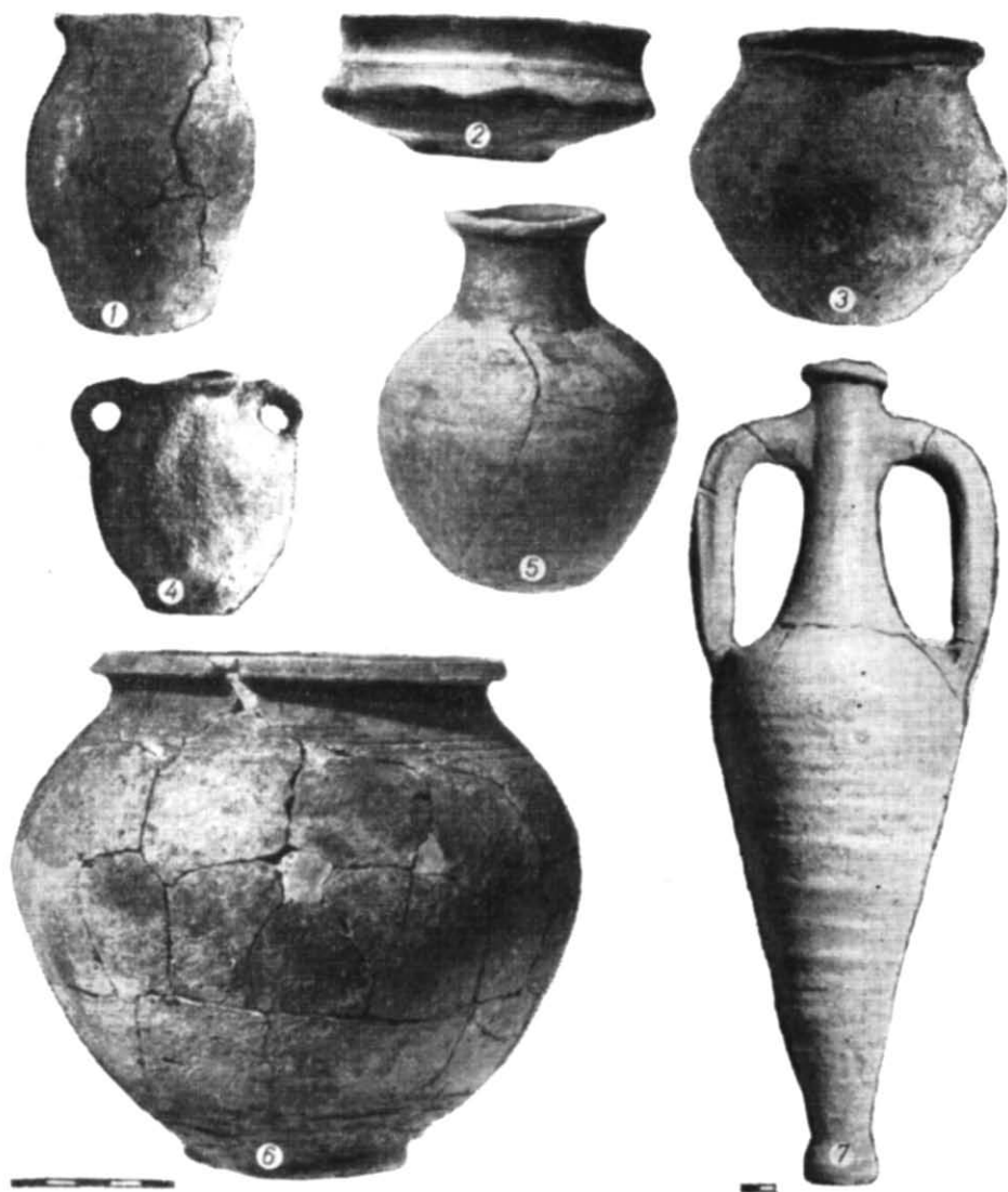
Рис. 2. Кераміка.

круті плічки. Вони прикрашені різьбленими лініями, а поверхня нижньої частини посудин має зазубрини (рис. 2, 6). Лощінням були покриті переважно миски відкритого та закритого типів, виготовлені з добре відмуденої глини. Особливо виразні: сіролощена мисочка біконічної форми з горизонтальним валиком у верхній частині і овальними зрізами