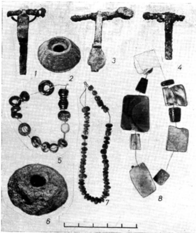
Рис. 3. Речові знахідки.

Серед металевих знахідок насамперед назвемо п'ять арбалетних бронзових фібул з залізною віссю пружини. Чотири з них підв'язного типу, причому у однієї була розширена донизу ніжка. П'ята мала приймач голки, зроблений разом з ніжкою у вигляді вигнутої смужки металу (рис. 3, 1, 3, 4). Метал у Вікторівському могильнику зберігся погано. Визначені уламки належали ножам та голкам. В жіночих похованнях виявлено кістяні гольники. В дитячому похованні було 10 астра-