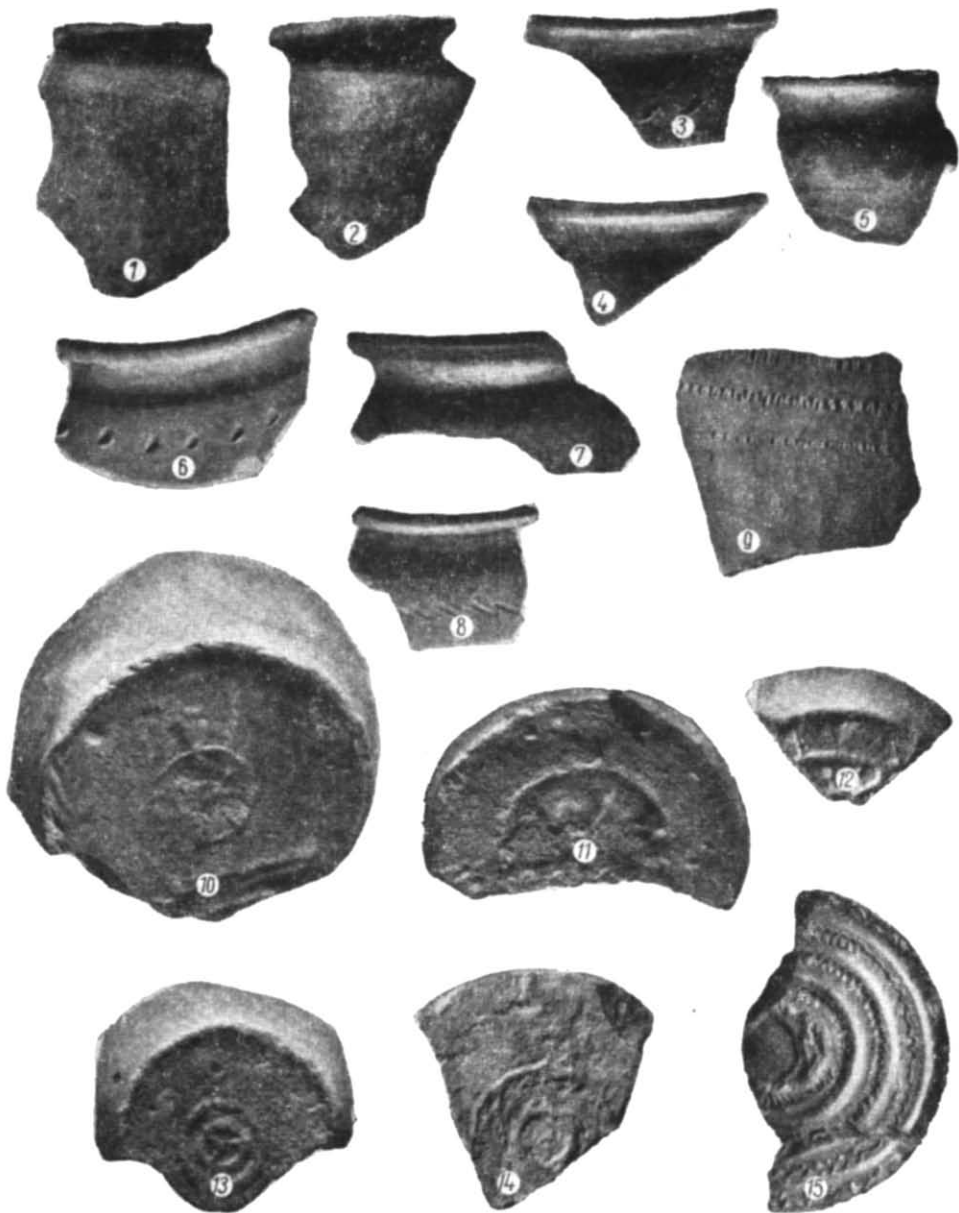
Рис. 3. Кераміка з городища біля с. Жовнин.