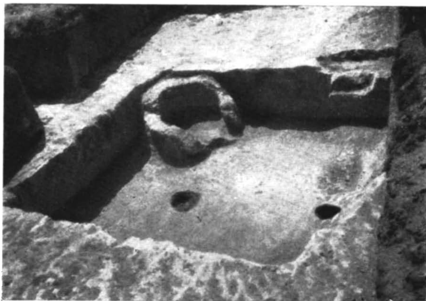
Рис. 2. Залишки напівземлянки № 1 на городищі біля с. Жовнин.

Третя група кераміки близька до другої групи і відрізняється від неї лише профілем вінець (рис. 3, 6, 7, 8). Вінця цієї групи дуже відігнуті назовні, по їх краю з внутрішнього боку проведена глибока боро-