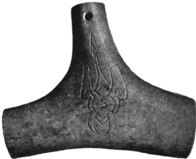
Рис. 4. Кістяний предмет із зображенням знака Рюриковичів з городища біля с. Жовнин.

Дослідження могильника, залишки якого були виявлені в ярі на відстані 500 м на південний схід від хут. Панського, показали, що в період Київської Русі на його місці був невеликий горб. За межі горба