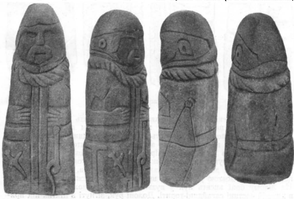
Рис. 1. Стела з с. Ольховчик.

В Донецькому обласному краєзнавчому музеї зберігається кам'яна статуя скіфа-воїна, яка надійшла до музею в 1950 р. з с. Ольховчик,