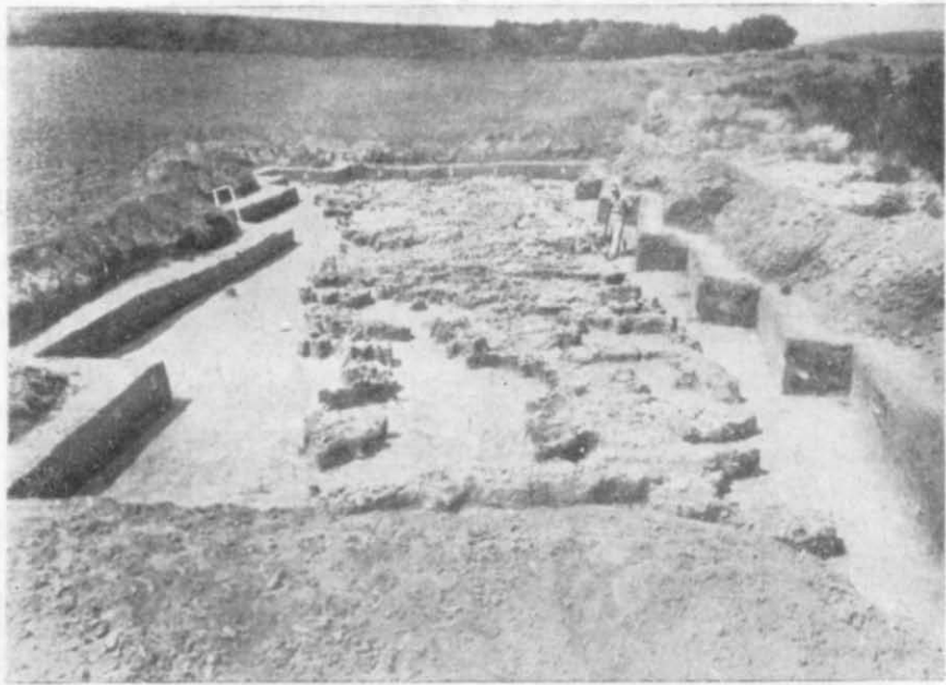
Рис. 1. Площадка № 2. Вид з півдня.

У першому приміщенні, в північній його половині, виявлені сліди печі. В центральних — другому і третьому приміщеннях — простежено залишки двох печей, підвищені ділянки підлоги у вигляді плитчастих