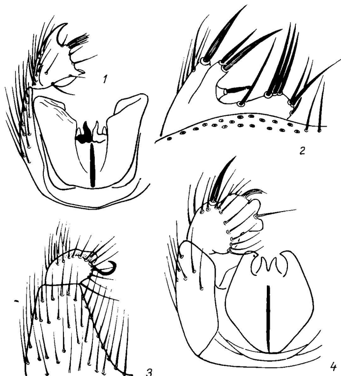
Рис. 3. Zygomyia valida Winnertz (1, 3), Z. vara (Staeger) (2, 4): 1, 4 — гениталии самца с дорсальной стороны; 2, 3 — гоностиль с вентральной стороны.

M_{3+4}+Cu_1 расположено вблизи края крыла (рис. 1, 8). Жилка M_{3+4} короткая, тонкая, с редуцированным основанием, часто не доходит до края крыла. У отдельных экземпляров M_{3+4} отсутствует на одном из крыльев. Ряд признаков данного вида, такие как маленькие размеры тела, особенности хетотаксии средних и задних голеней, структура гениталий, говорят о принадлежности его к роду Zygomyia . На близость M. semifusca к представителям последнего таксона неоднократно указывалось в литературе (Edwards, 1925; Laffoon, 1956; Островерхова, 1979).