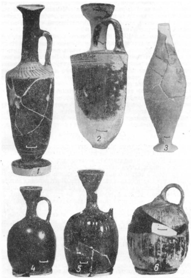
Таблиця II. Лекіфи V—IV ст. до н. е.

Червонофігурні лекіфи ольвійського некрополя V—IV ст. до н. е., дуже нечисленні. Вони представлені одиничними знахідками аттичної кераміки. Повністю збереглося всього два екземпляри.