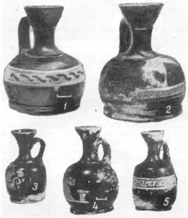
Таблиця III. Червонофігурні арибалічні лекіфи.

Варіантом цього типу є лекіф із комплексу 1901/66 64 . Він відрізняється від попередніх лише формою корпусу, а також манерою вико-