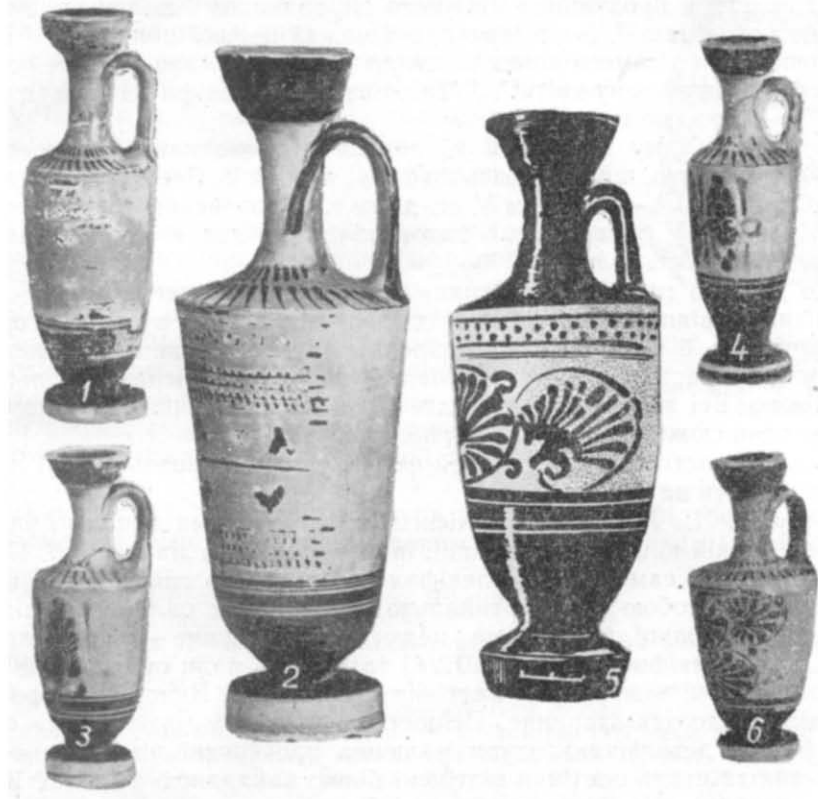
Таблиця 1. Чорнофігурні лекіфи.

В класичному некрополі Ольвії представлені чорнофігурні лекіфи найпізнішого стилю 20 . Видимо, зв'язок лекіфів з культом був причиною тривалого збереження традиційної чорнофігурної техніки в той час, коли червонофігурна кераміка вже ввійшла в загальний ужиток 21 . Для цих лекіфів особливо характерна чисто декоративна орнаментация по