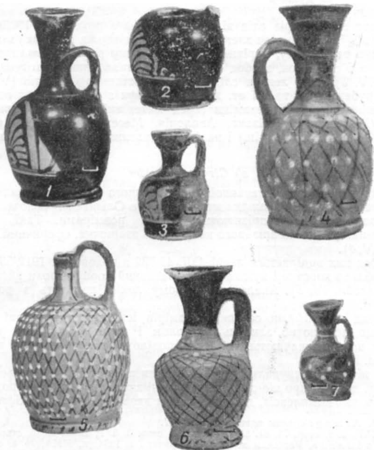
Таблиця IV. Червонофігурні та сітчасті лекіфи.

Зважаючи на форму лекіфів, комплекси супровідного інвентаря, ці ольвійські лекіфи слід датувати другою—третьою чвертю IV ст. до н. е. 76