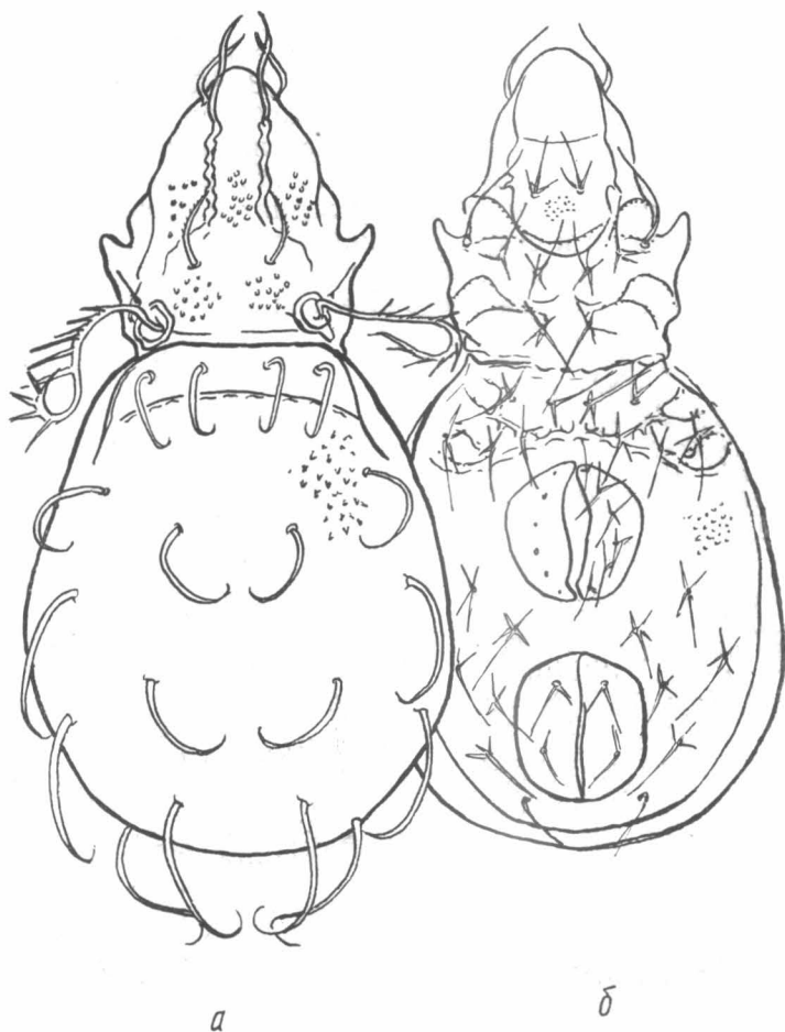
Рис. 2. Eremulus elegans Gordeeva, sp. n.: а — вид сверху; б — вид снизу.