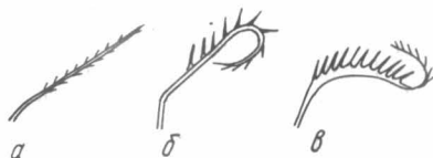
Рис. 3. Трихоботрии орбатид: а — E. flagellifer ; б — E. elegans ; в — E. antis .

сут 4 луча, анальные (2 пары) — 2 луча. Кокостеральная область грубо пунктирована, аногенитальная покрыта бугорками.