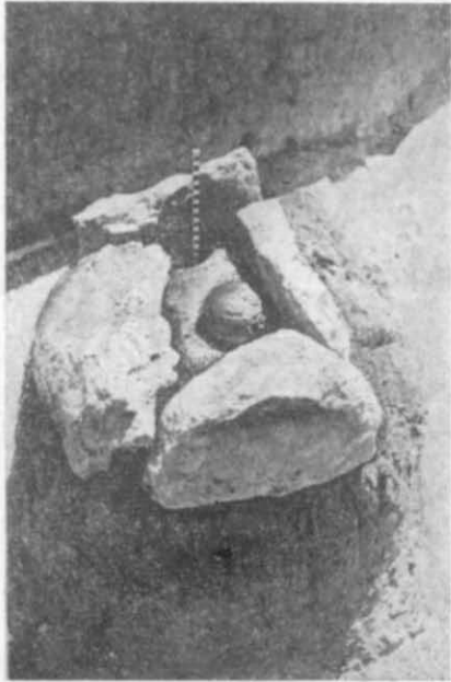
Рис. 3. Кам'яний ящик.

Поховання № 4 (пізній час древньооямної культури). Кістяк лежав на спині, головою на північ. Ноги простягнуті, а стопи, мабуть, були покладені одна на одну. Положення рук простежити не вдалося. Кістяк лежав біля південної стіни кам'яного спорудження 3 на древній денній поверхні.