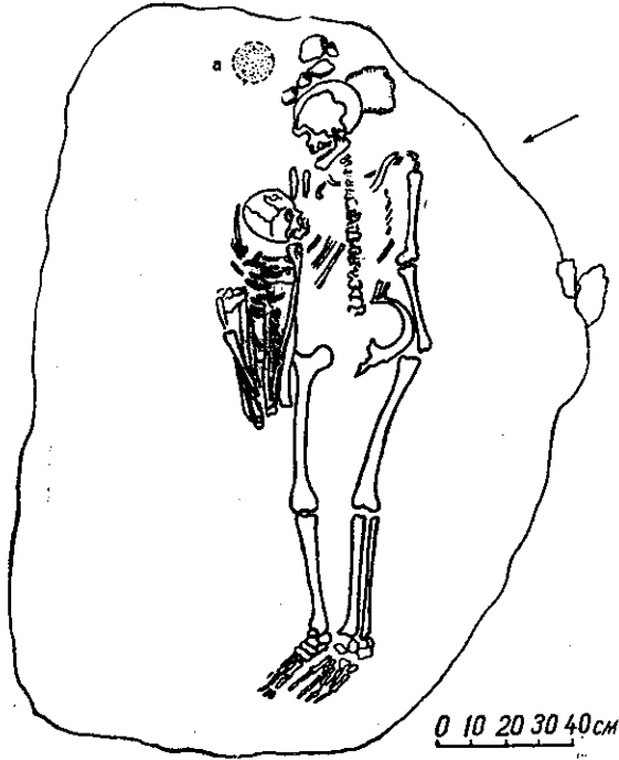
Рис. 4. Поховання № 22

Поховання № 21 (катакомбне). У південно-західній полі кургана, в ямі, впушеній в материк (глибина 0,3 м, довжина 1,9 м, ширина 1,55 м), знаходився кістяк. Яма зверху була закладена великим камінням під яким знаходилися дві великі кам'яні плити (0,60×0,70 м та 0,58×0,80 м), що не повністю перекривали могильну яму. Кістяк орієнтований головою на північний захід, витягнений на спині.