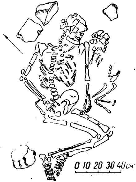
Рис. 2. Поховання № 2

Підстилкою для кістяка служила галька, на яку в свою чергу було поставлене й саме спорудження. Товщина стінок спорудження повсюди була однакова — 1,5 м. З південної сторони центрального кам'яного спорудження, майже впритул до нього, знаходився значно менших розмірів суцільний кам'яний завал з таких же по розміру блоків діориту. В плані кам'яний завал мав майже квадратне окреслення (2×1,6 м). Висота цього завалу досягала 1,15 м. Під кам'яним завалом було знайдено поховання № 2.