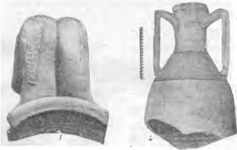
Рис. 7. Уламок ручки з клеймом (1) і верхня частина амфори з двоствольними ручками (2).

Дуже цікава знахідка невеликого уламка червонолакової чашечки італійського походження початку I ст. н. е. з рельєфним зображенням жіночих фігур на фоні архітектурної споруди із східчастим стилобатом і орнаментованим фризом; перед спорудою — довгі стеблини якихось водяних рослин.