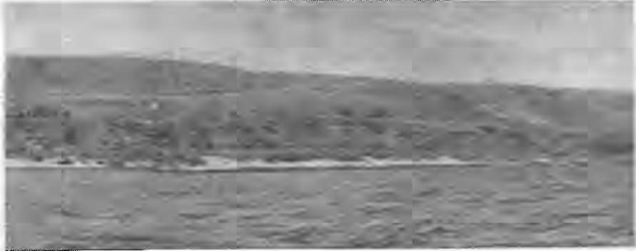
Рис. 1. Загальний вигляд рельєфу місцевості (знаком X позначено розкоп III).

Будівлі ранішого часу виявлені частково в південній і центральній частинах поселення. В південній його частині, під кам'яною огорожею перших століть н. е., виявлено залишки кам'яних основ великої прямо-