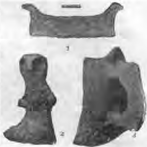
Рис. 6. Антропо- і зооморфні скульптурні зображення.

Серед цього посуду вирізняються дві групи різного походження: ольвійського (а почасти, можливо, і боспорського) і малоазійського. До останньої належать червонолакові пергамські кубки з білим і темним розписом, з парними ручками характерної форми; привертає увагу уламок ручки з рельєфними волютами, вкритої лаком жовтуватооранжового кольору.