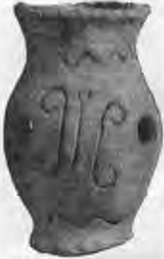
Рис. 9. Глиняна курильниця з тамгоподібним знаком.

Другий тип — це циліндрична курильниця з рельєфними горизонтальними валиками (представлений уламком стінки).