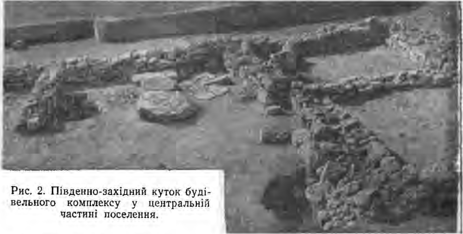
Рис. 2. Південно-західний куток будівельного комплексу у центральній частині поселення.

Двокамерні будівлі подекуди об'єднані внутрішнім двориком або відкритим з одного боку приміщенням, що мало, мабуть, зверху навіс.