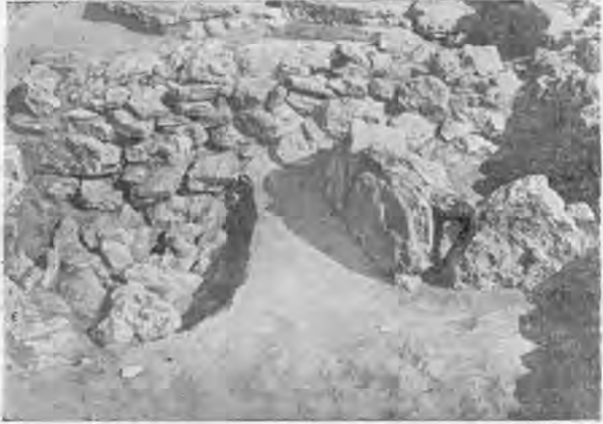
Рис. 4. Загородка і яма, заповнена камінням.

Остеологічний матеріал, зібраний на поселенні, свідчить про наявність на ньому усіх видів великої і дрібної худоби (бик, кінь, вівця-коза, свиня), а також собаки. Переважають кістки бика, потім коня і вівці-кози, поодинокі кістки свині.