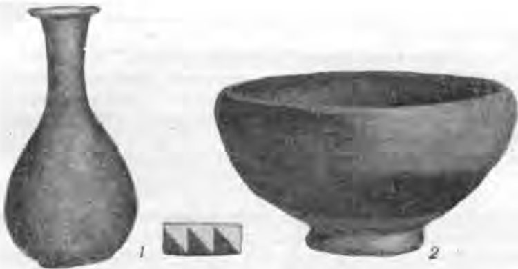
Рис. 8. Бальзамарій (1) і червонолакова чаша (2).

Крім побутового інвентаря, на поселенні знайдено дві теракотові статуетки. Одна з них, виготовлена з темносірої глини, грубуватої роботи, являє собою зображення хлопчика з гускою — сюжет, досить поширений на Боспорі в першій століття н. е. Однією рукою хлопчик схопив гуску за шию, другою — удержує її за дзьоба, якого гуска намагається виволити.