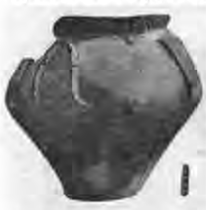
Рис. 5. Ліпна корчага з наліпним орнаментом.

Характерною особливістю цієї групи є також форма гострореберної миски з темносірим і рожевожовтуватим лошінням, що частково нагадує миску так званого корчуватівського типу (гострореберність, гранчасті вінця). Оригінальна форма циліндричної або конічної кружки з однією або двома бічними петельчастими ручками, круглими або прямокутними в перерізі. Вона характерна для дакійського посуду.