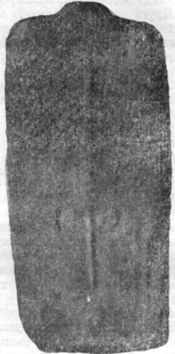
Рис. 2. Стела з с. Наталівки (тильний бік).

Більш того, дослідження останніх років, проведені на Нижньому Поволжжі, показали, що багато курганів, які колись вважали типовими древньоамніми, в дійсності належать до досить пізніх часів, не давніших від періоду так званих катакомбних поховань. Зокрема це стосується і курганів м. Степного (кол. Елісти), які рядом ознак наближаються до № 50 та 52 курганів Білозерки 1 .