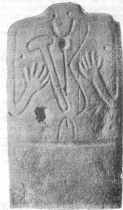
Рис. 1. Стела з с. Наталівки (лицьовий бік).

Оскільки на перший погляд є підстави пов'язувати білозерські стели з так званими древньоамніми похованнями, можна було б говорити про більш древній вік цих стел. Проте, на нашу думку, курган № 52 цього могильника (за нумерацією Г. Л. Скадовського) не можна вважати таким же давнім, якими, за визначенням багатьох дослідників, є древньоамні поховання Донеччини, виділені В. О. Городцовим.