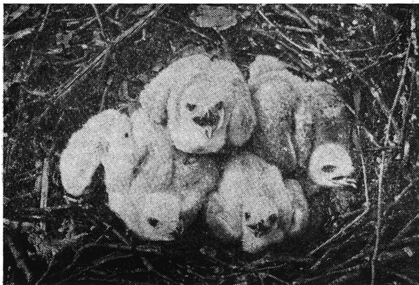
Рис. 1. Пуховички курганника.

около гнезда в окр. г. Смелы (Черкасская обл.); позже, 2.IV 1939 г., П. П. Орлов (1948) в соседнем Городищенском р-не в окр. с. Староселье добыл в Мошногорском лесу самку с готовым к откладке яйцом. Последняя находка была в Александровском р-не Кировоградской обл., где М. А. Воинственский (1950) в апреле 1940 г. нашел