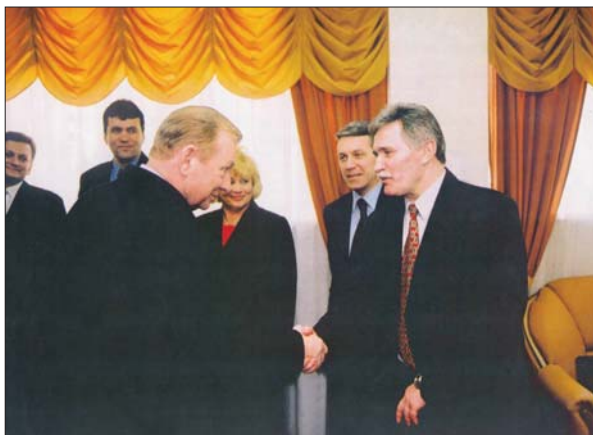
Перед нарадою з Президентом України Леонідом Кучмою

ївської Русі, що засвідчує історичну тяглість, беззастережно можна оцінити як подвиг.