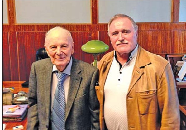
У кабінеті президента НАН України Бориса Євгеновича Патона

Як результат такої форми доброзичливого наукового спілкування одна за одною почали виходити у світ індивідуальні та колективні монографії, наукові збірники, посібники тощо. Ці видання було визнано у науковому середовищі і, зрештою, у суспільстві. Колеги-вчені дивувалися спритності директора у пошуку коштів для забезпечення постійного потоку друку, адже щороку публікувалося по 20–25 (!) книг, що на сьогодні сукупно становить понад 500 книжкових видань, багатьма з яких