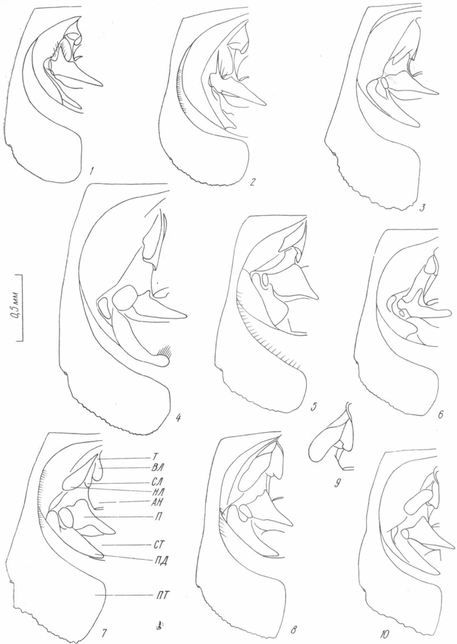
Рис. 1. Генитальный сегмент самца Aradus :

1 — A. pictellus Kerzh.; 2 — A. pictus Väg.; 3 — A. anisotomus Put.; 4 — A. herculeanus Kir.; 5 — A. betulae L.; 6 — A. brenskiei Reut.; 7 — A. hieroglyphicus Sahlb.; 8 — A. ribauti Wagn.; 9 — A. krueperi Reut.; 10 — A. caucasicus Kol.; Т — IX тергит; ВЛ — внутренняя лопасть IX тергита; СЛ — срединная лопасть IX тергита; НЛ — наружная лопасть IX тергита; АН — анальная трубка; П — парамер; СТ — IX стернит; ПД — парандрий; ПТ — VIII паратергит.