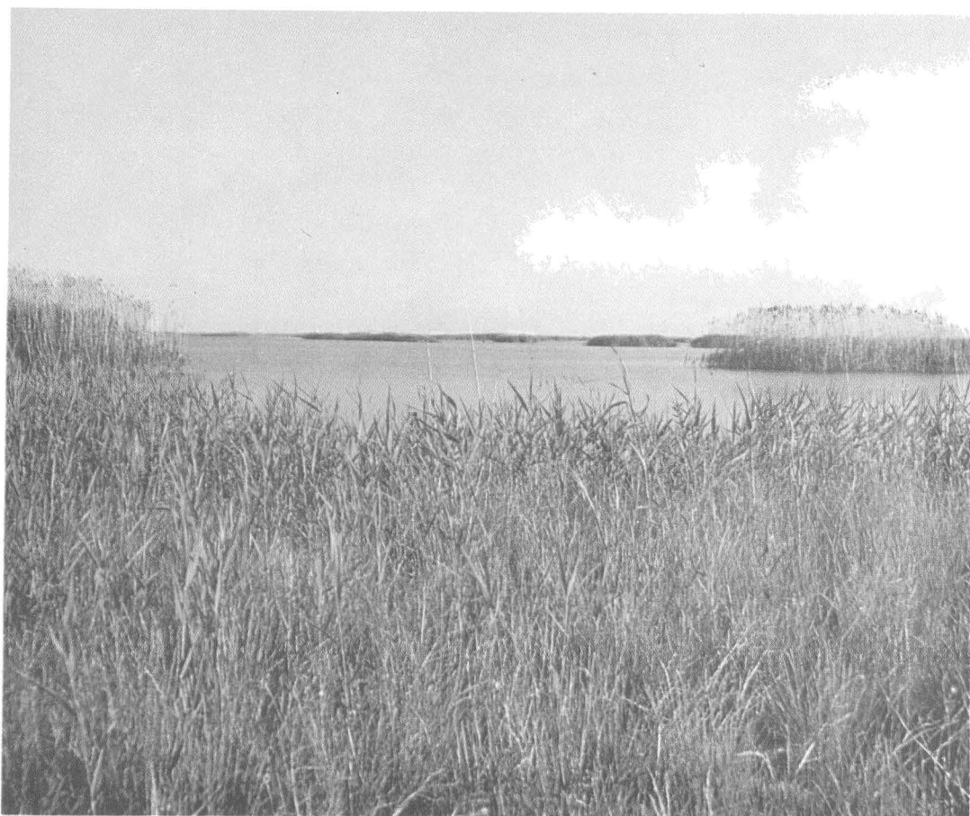
Потиевское озеро.