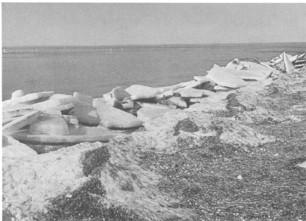
Остров Долгий (февраль 1976 г.) — основное место зимовки лебедей.