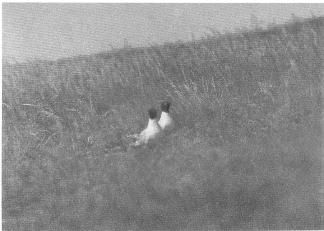
Черноголовые чайки, остров Орлов.