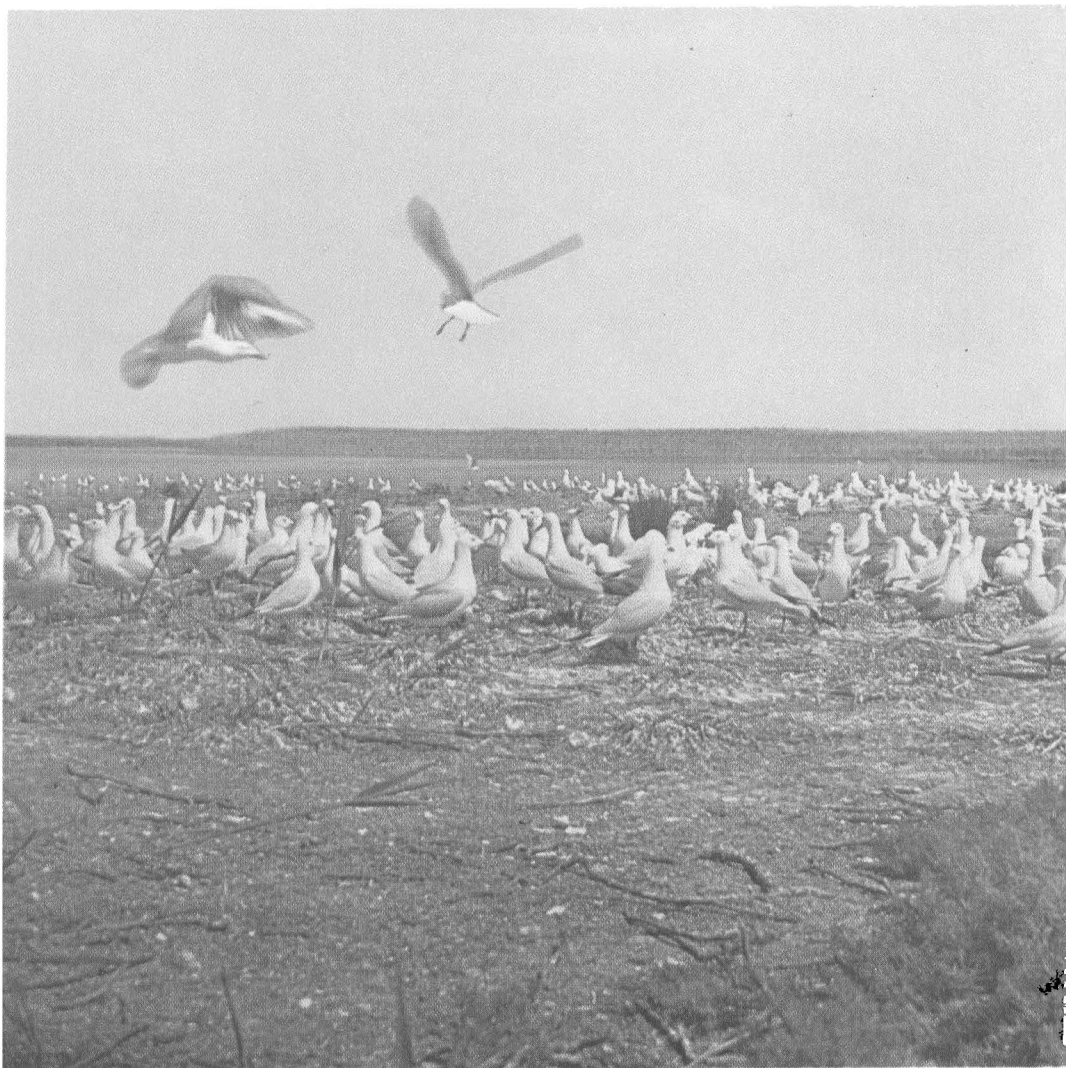
Колония морского голубка на острове Орлов.