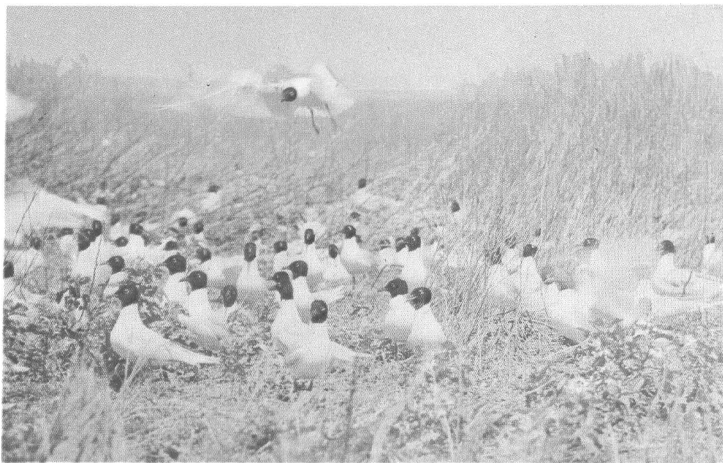
Черноголовые чайки на гнездовье.