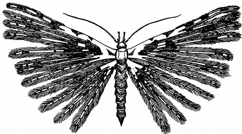
Рис. 1. Alucita helena Ustjuzhanin sp. n., ♂ (рисунок Е. А. Артемьевой).