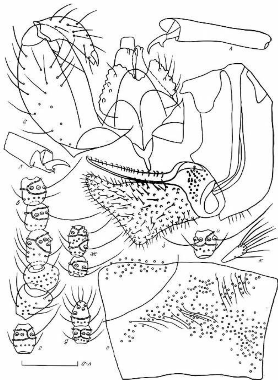
Рис. 1. Детали строения Stefaniola hammodae sp. n.: а-д — самец; е-л — самка; а — гениталии; б, в — коготок лапки; в — скапус, педиселл, 1—3-й членики жгутика; г, и — 5-й членик жгутика; д — 12-й и 13-й членики жгутика; е — дорсальная сторона стерноплевры; ж — 15-й и 16-й членики жгутика; з — яйцеклад; К — щупик (масштаб 0,1 мм).

крупными размерами тела. От S. ustjurtensis Fedotova из стеблевых галлов на ежовнике шерстистоногом ( Anabasis eriopoda (Schrenk) Venth.) (там же) новый вид отличается более вздутыми боковыми краями гонококентов, расширяющимися к основанию церками, удлиненными, а не поперечными средними члениками жгутиков самца и самки,