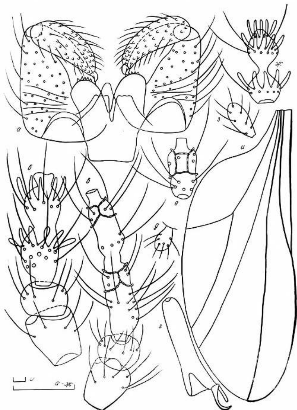
Рис. 3. Детали строения Halodiplosis hammadae sp. n.: а, б, г, д, ж, и — самец; в, е, з — самка: а — гениталии; б — скапус, педицелл, 1-й членик жгутика; в — скапус, педицелл, 1-й и 2-й членики жгутика; г — коготок лапки; д, з — щупик; е — 5-й членик жгутика; ж — 12-й членик жгутика; и — крыло (масштаб 0,1 мм).

Самка. Длина тела 2,2—3,4 мм при нерасправленном яйцекладе. Антенны 2+11, членики жгутика со стебельками, средние с перетяжкой в базальной трети, длина 1-го в 1,3 раза больше длины 2-го, длина 5-го в 2,2 раза больше ширины, базальное утолщение в 3,9 раза больше стебелька. 11-й членик слегка сужается к вершине, в 1,3 раза длиннее 10-го. Щупик овальный, но сильнее расширен в дистальной