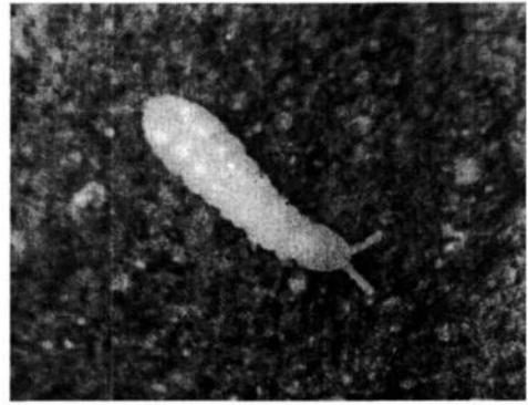
Рис. 2. Половозрелая особь Protaphorura 6-го личиночного возраста.

В целом, наибольшая двигательная активность среди рассмотренных семейств присуща энтомобриидам: особи Lepidocyrtus sp., Tomocerus vulgaris при прямом освещении стремительно передвигались по бюксу, совершая резкие движения головой и всем телом, также частые скачки на значительные расстояния, постоянно ощупывая антеннами друг друга и субстрат.