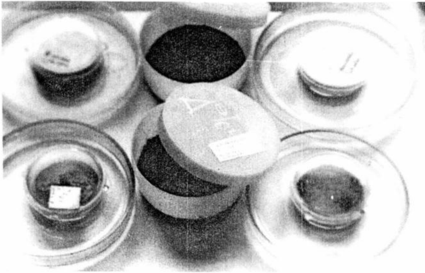
Рис. 1. Общий вид бюксов для культивирования коллембол.

Fig. 1. General view of the cultivation bottoms.