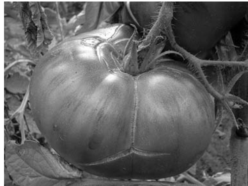
Рис. 2. Плоды сорта Черные ( gf, f )

Изучение биохимических эффектов гомозигот B/B , gf/gf и B/B//gf/gf подтвердило тот факт, что гены B и gf оказывают противоположное влияние на содержание \beta -каротина и ликопина, что и определяет эффекты их межгенного