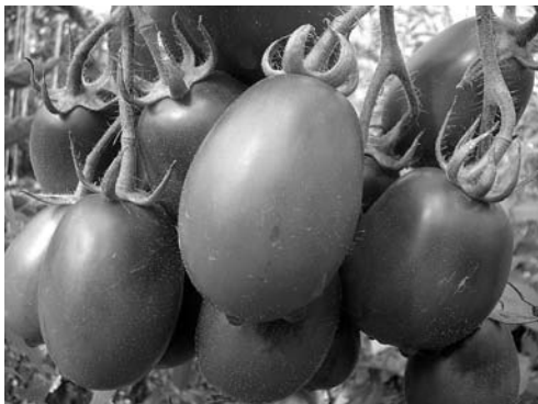
Рис. 1. Плоды сорта Мавр ( gf, o )

В расщепляющихся популяциях второго и третьего поколений ( F_{2-3} ) от-