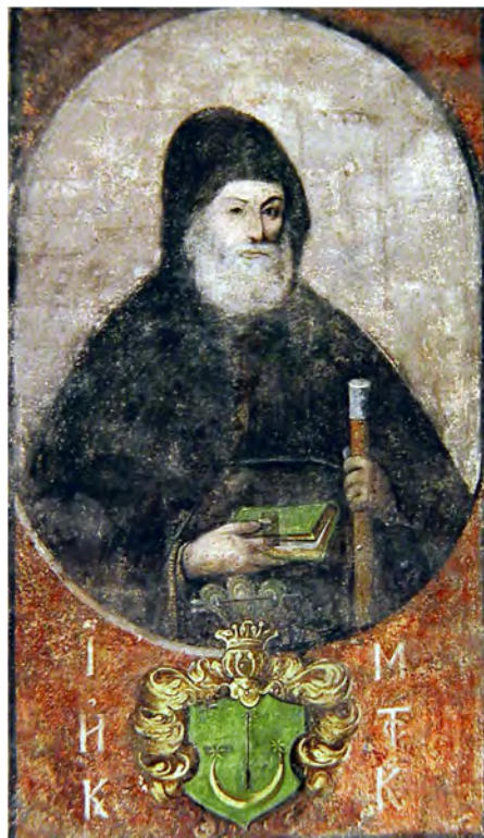
Рис. 4. Портрет ігумена Інокентія Монастирського. Темпера, XVII ст. Написаний на замовлення Дмитрія Туптала.

Саме тоді на південній стіні кирилівського храму з розпорядження ігумена Дмитрія Туптала було створено портрет 14 кирилівського ігумена Інокентія Монастирського – його доброго друга. Інокентій Монастирський помер у 1697 р., і після нього Дмитрій Туптало прийняв ігуменство в Кирилівському монастирі.