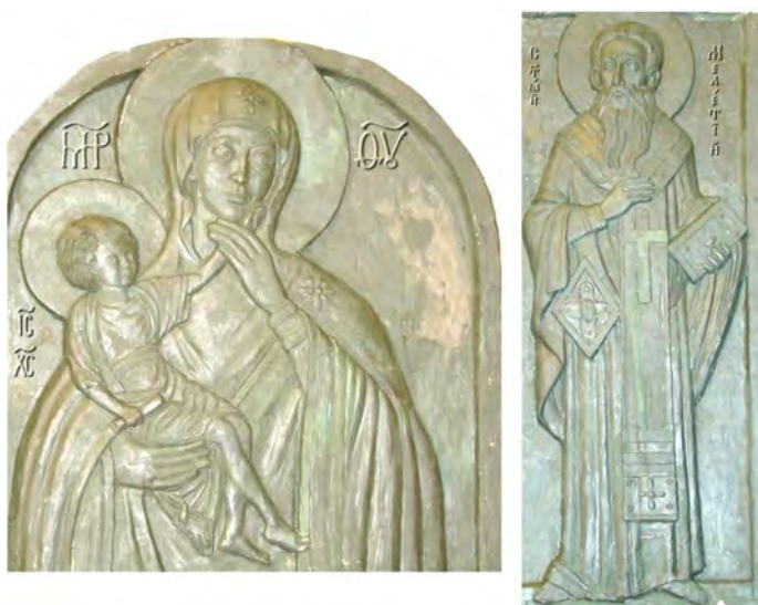
Рис. 10. Взірці ікон. Пластилін. Автор – скульптор О. Моргацький.