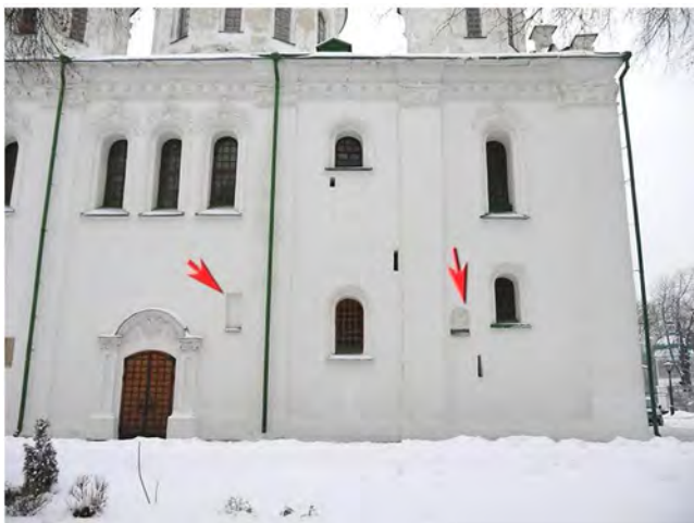
Рис. 2. Кирилівська церква. Північний фасад. Ніші для пам'ятних образів.

Поховання князів із роду Ольговичів започаткувало історію некрополя в Кирилівському храмі 2 . З похованнями XVII–XVIII ст. пов'язані ікони (образи святих на мідних дошках), встановлені в північній стіні Кирилівського храму. У наших дослідженнях ми вже зверталися до цих ніш 3 , але тривав науковий пошук, і з'явилися нові свідчення, та головне – бажання відтворити пам'ятні дошки, які колись були ознакою храму.