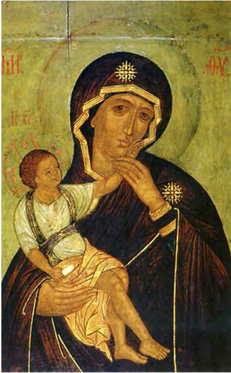
Рис. 7. Ватопедська Божа Матір. Родова ікона родини Тупталів.