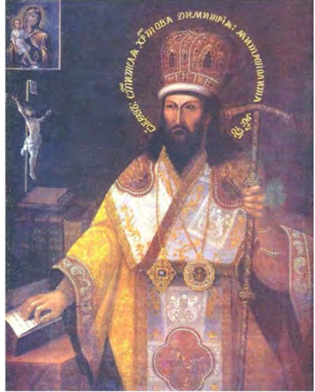
Рис. 3. Портрет святителя Димитрія Ростовського.

Однак, чи був Мелетій Дзик справді похований у Кирилівській церкві, як свідчить вищенаведений документ? Певний час, спираючись на цей документ, ми вважали, що видатний церковний діяч, друг святителя Димитрія Ростовського ігумен Мелетій був похова-