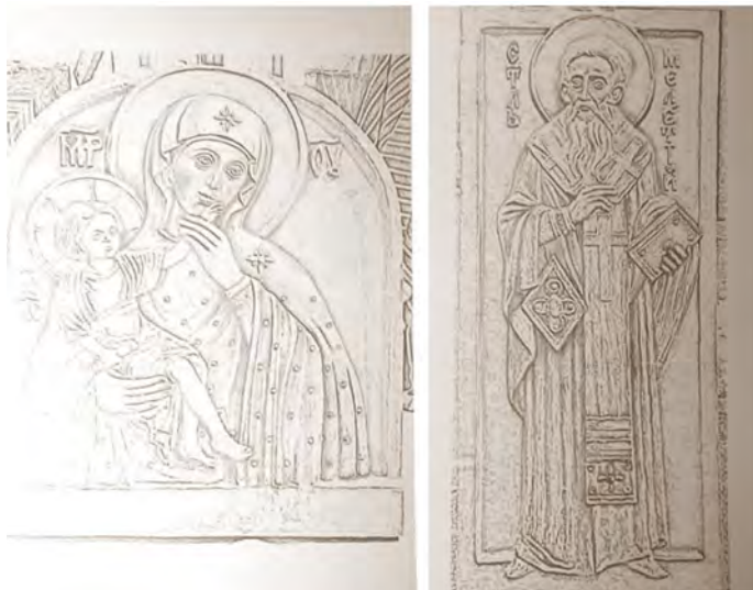
Рис. 9. Креслення образів. Автор – скульптор О. Моргацький.