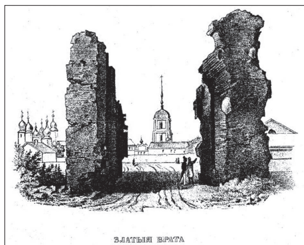
Рис. 4. Зображення Золотих воріт у книзі «Обозрение Киева в отношении к древностям», 1847 р.

Зокрема, в книзі С. Висоцького надруковано малюнок, який дуже близький до малюнку «Обозрения Киева» (Высоцкий 1982, с. 33), але звідки він був запозичений, невідомо. Проте зрозуміло, що таких схожих зображень було чимало.