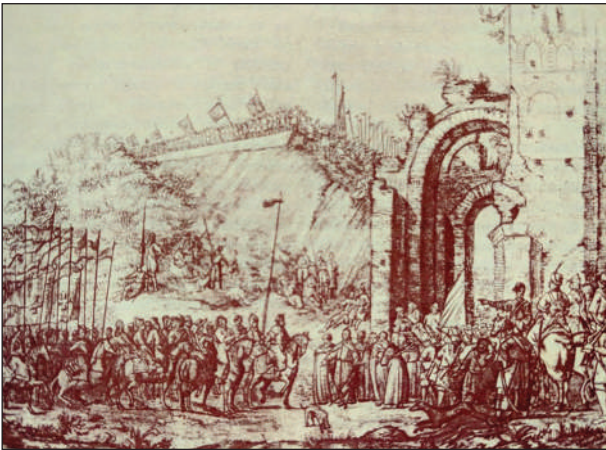
Рис. 1. Золоті ворота, 1651 р., копія з малюнка А. ван Вестерфельда