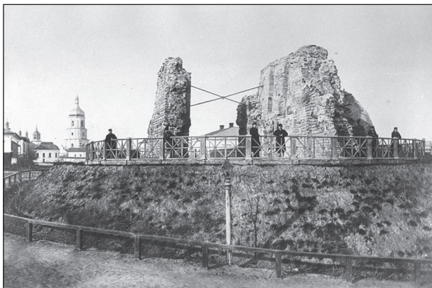
Рис. 10. Золоті ворота