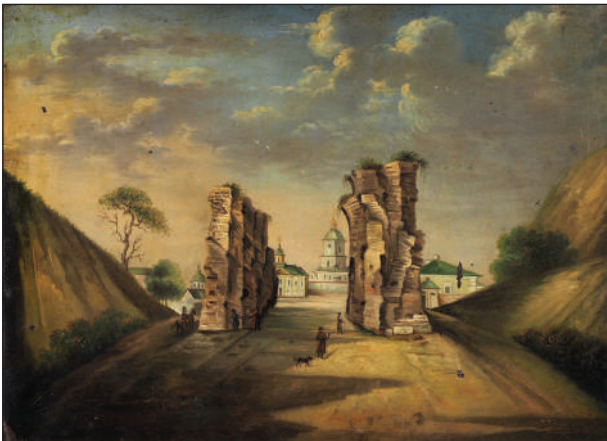
Рис. 5. Золоті ворота на мідній пластинці, виготовленої на замовлення К. Лохвицького