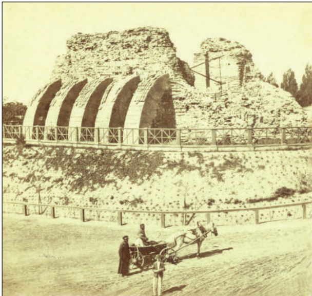
Рис. 9. Золоті ворота, 1870-ті рр.