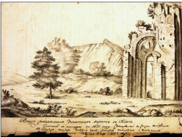
Рис. 2. Золоті ворота, акварельна копія з малюнка А. ван Вестерфельда, зроблена для митрополита Київського Євгенія

вони не відповідали правилам фортифікації та були розібрані (Высоцкий 1982, с. 32).