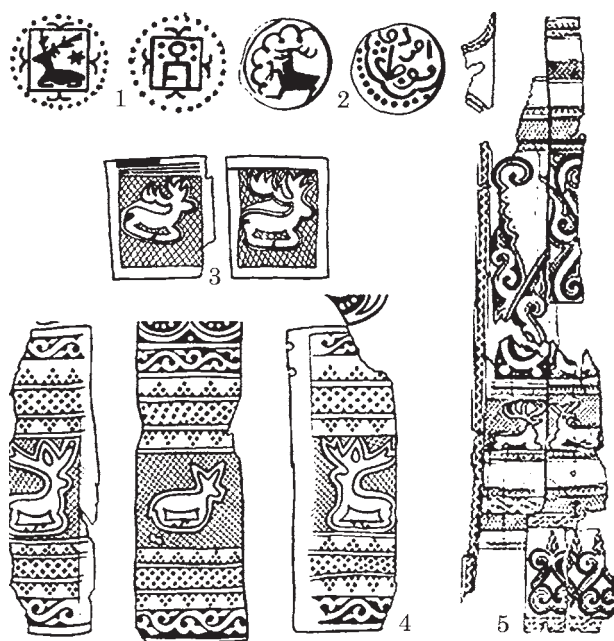
Рис. 3. Образ оленя: 1 — мідна золотоординська монета з оленем; 2 — мідна золотоординська монета з оленем (?); 3—5 — кістяні обкладки з оленями (за: 1 — Лебедев 1990; 2 — Федоров-Давыдов 2003; 3—5 — Малиновская 1974)

буху / буха, що відтворює поділ монголів на дві групи, спрямовані на легітимність влади Чингізхана і його нащадків. Також допускається синонімічність biqi і biqa (бик — самець оленя) (Крадин, Скрынникова 2006, с. 188, 196). Буга — бик, а також олень розглядаються загальноалтайською лексичною основою, форма буга в застосуванні до оленя може бути результатом фонетичної подібності назв і часткової однорідності господарської функції цих тварин (Севортян 1978, с. 230—232).