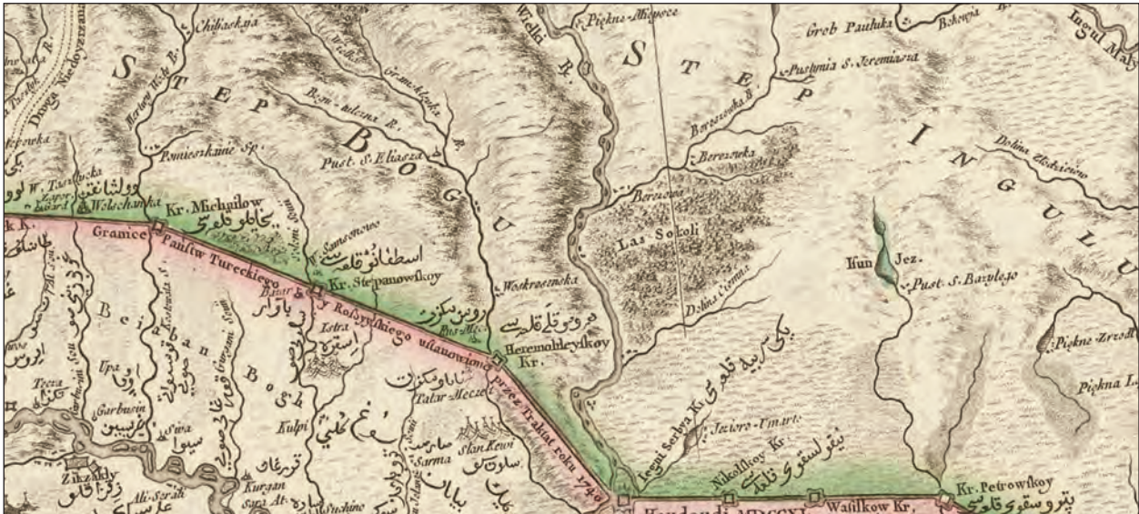
Рис. 5. Інгульський і Бузький степ на карті Річчі-Занноні 1767 р. (за Ricci-Zannoni 1772)

показано Бузький степ, а між Інгулом і Інгульцем — Інгульський (рис. 5; Ricci-Zannoni 1772, р. 24). Тому видається, що в степах між Бугом і Інгулом перебувала одна орда, а між Інгулом і Дніпром інша (або кілька). Іноді на картах середньовічна назва « boristene » (та її варіанти) показана в районі р. Інгул, яка впадає в Бугський лиман у районі сучасного Миколаєва (Гордеев, Терещенко 2017, с. 371).