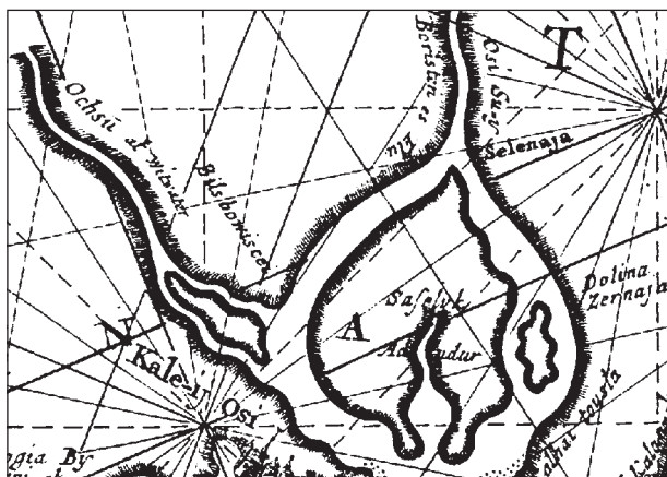
Рис. 1. Південний Буг на карті Н. Вітсена (за Witsen 1705)