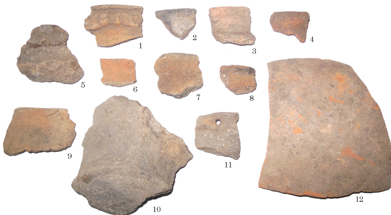
Рис. 2. Керамічний посуд із селища

Треба зазначити, що на місці знахідки монети після детального обстеження було знай-