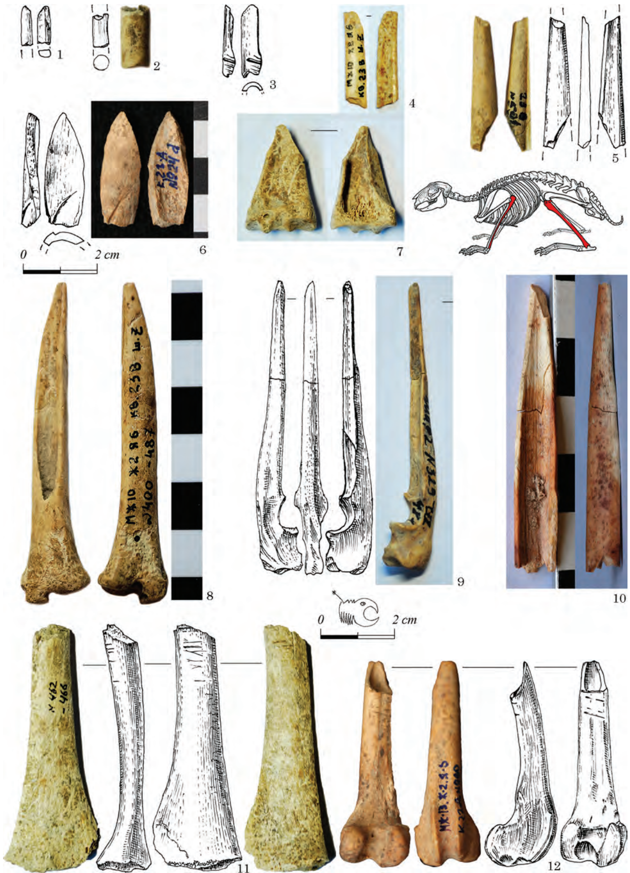
Рис. 3. Межиріч, яма 6: фрагменти голок, проколки та оброблені трубчасті кістки дрібних ссавців