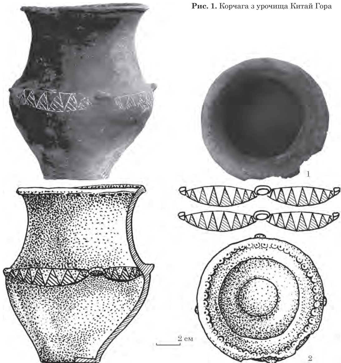
Рис. 1. Корчага з урочища Китай Гора

відігнутий і сплющений зверху, під ним наколи, яким зсередини відповідають «перлини», (серед них зрідка трапляються наскрізні проколи). Горло плавно розширюється донизу і приблизно на середині висини корчаги переходить в тулуб з дещо роздутими плічками. Перехід підкреслено чотирма пластичними наліпами, між якими прокреслений вузький орнаментальний фриз, точніше чотири окремі фігури лінзоподібної форми, заповнені навкісно заштрихованими трикутниками. За спостереженнями художника В. Г. Болвановича, який зробив малюнки корчаги і горщиків, штрихування нанесене лівою рукою. Орнамент промазаний білою пастою.