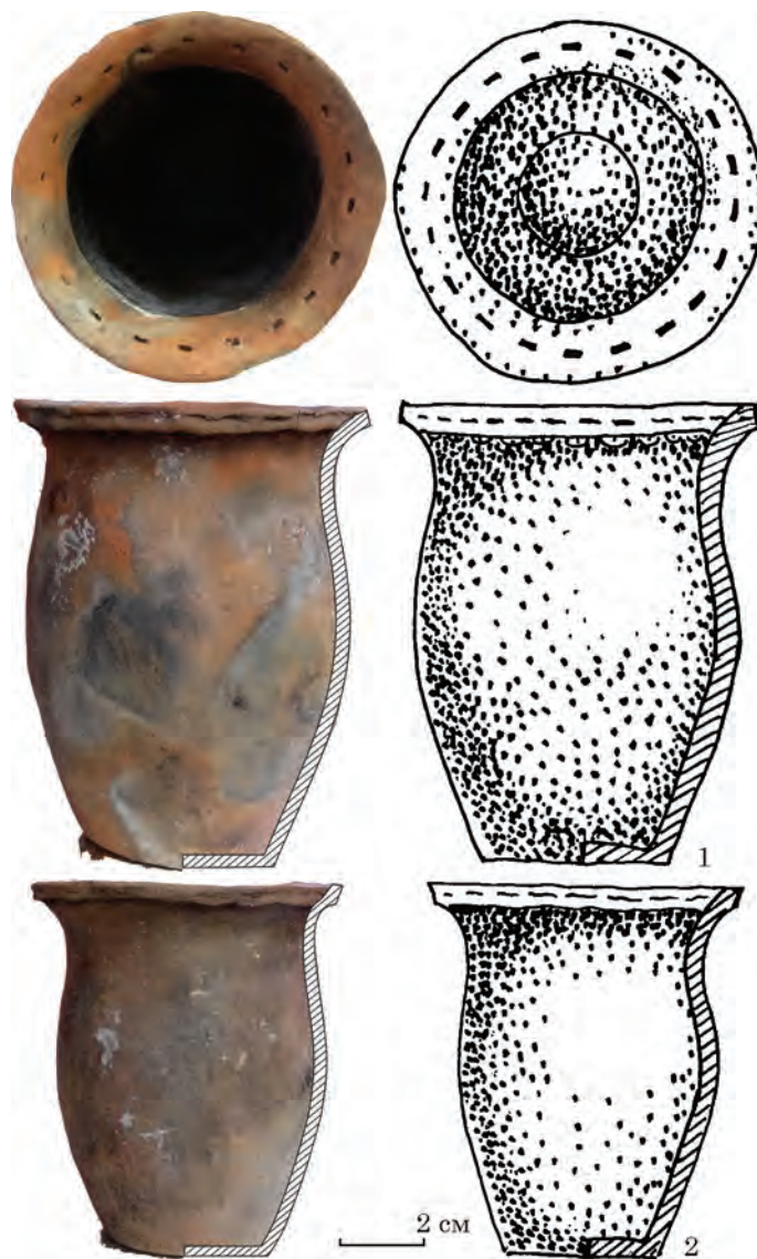
Рис. 2. Горщички з урочища Китай Гора

Іншою аналогією корчазі з урочища Китай Гора можна вважати типологічно близьку посудину з кургану 1/1999 на території Більського городища (ур. Перемирки; Кулатова, Супруненко 2010, с. 11—25, рис. 8; 9; фото 3: 2 на вкл. І; Бруяко 2005, рис. 11: 7, с. 51). Ця корчага крупніша — 36,6 см заввишки, діаметр вінець 23,3 см, тулуба 29,4 см (рис. 3: 2). За своїми пропорціями і особливостями форми вона близька до китайгородської, але краї вінець у неї відігнуті сильніше і горизонтально зрізані, а затертий білою пастою орнамент — типово жаботинський (типи 13 і 17) — притаманний посуду з пам'яток VII ст. до н. е. (Бруяко 2005, с. 23, 27, 28, рис. 2). Цю дату підтверджують орнаментований черпак, миска на високому піддоні і наконечник стріли з цього ж комплексу, які автори публікації датують другою половиною — кінцем VII ст. до н. е. (Кулатова, Супруненко 2010, с. 25). За типом ор-