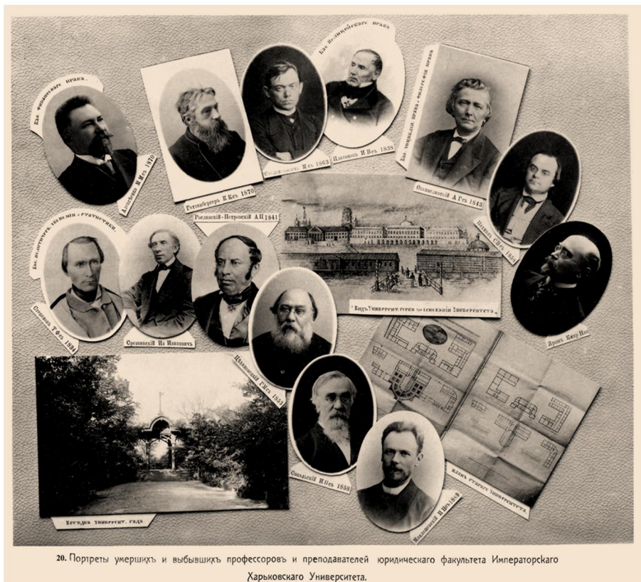
20. Портрети умерших и выбывших профессоров и преподавателей юридического факультета Императорского Харьковского Университета.