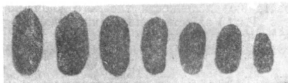
Рис. 1. Индивидуальная изменчивость коконов грушевой плодожорки.

Исследования, проведенные в 1966—1968 гг., показали, что плодожорка зимует в плотном шелковистом коконе на стадии гусеницы. Коко-