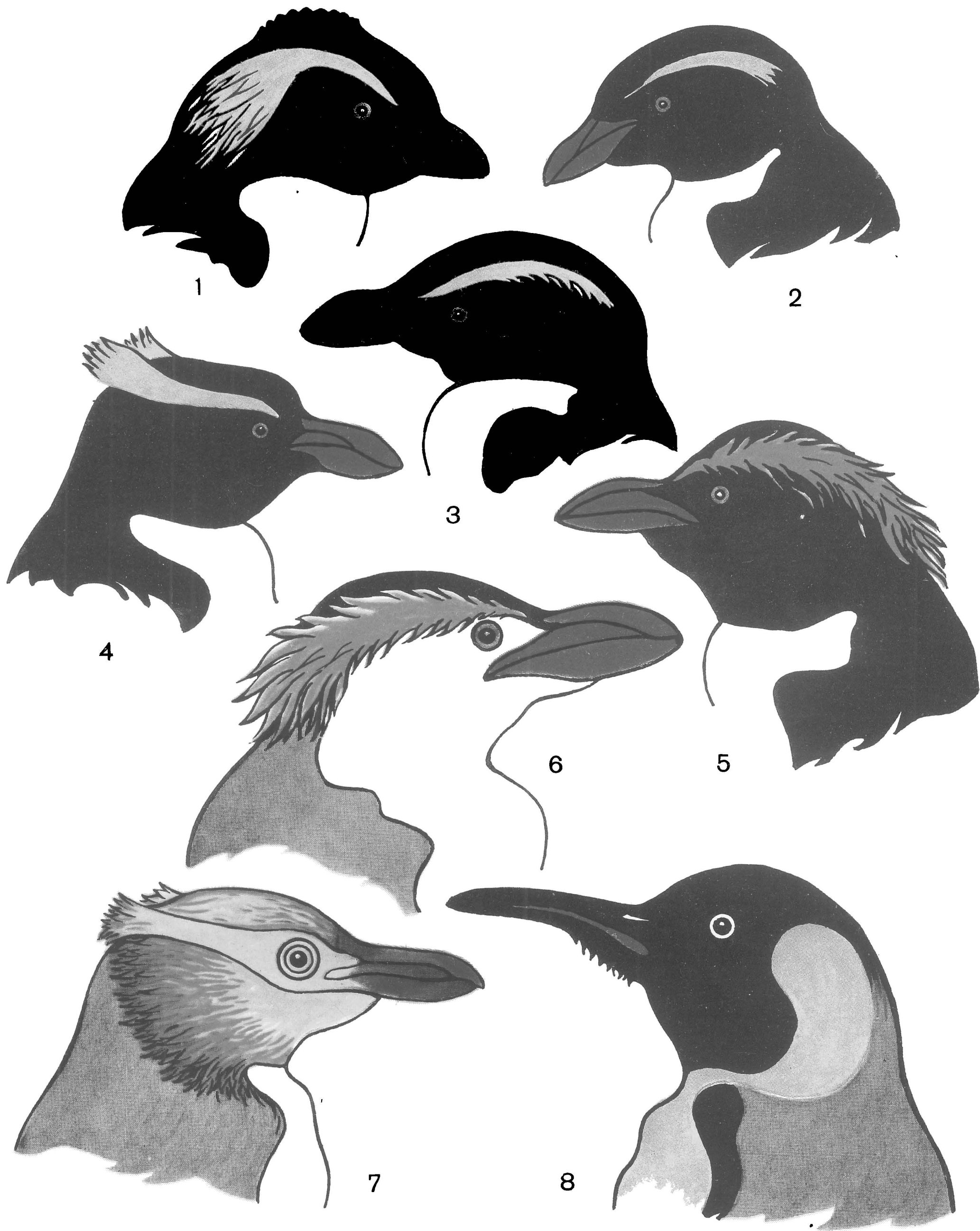
Рис. 1. Головы пингвинов:

1 -- хохлатого; 2 -- фьордлэндского; 3 -- островов Снейрс; 4 -- Склатера; 5 -- золотохохлого; 6 -- Шлегеля; 7 -- желтоглазого; 8 -- императорского.