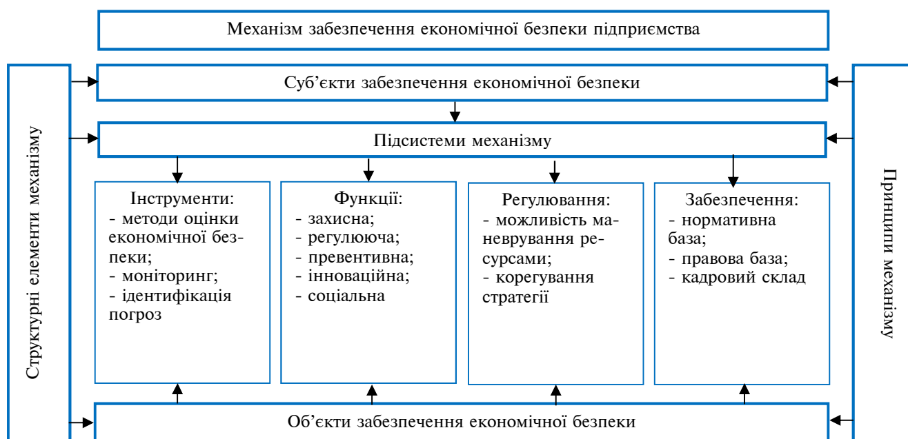
Рис. 2. Механізм забезпечення економічної безпеки підприємства

1) дотримання інституційно закріплених і неформальних правил і норм функціонування механізму;