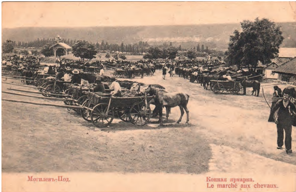
Ілюстр. 7. Кінний ярмарок у Могилеві-Подільському