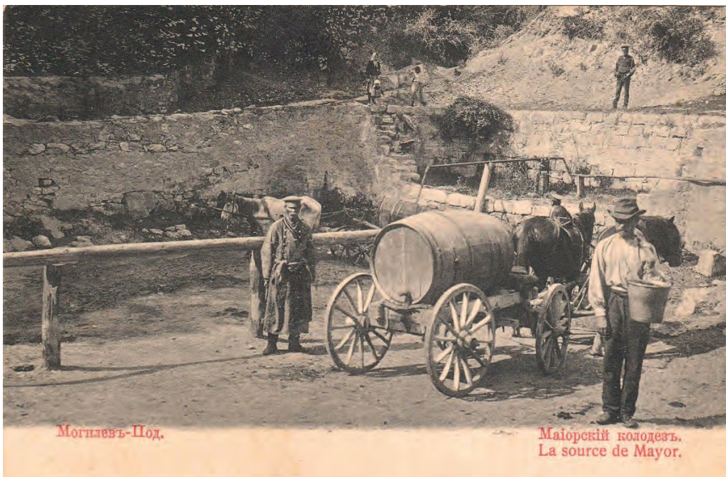
Ілюстр. 8. Майорський колодезь у Могилеві-Подільському