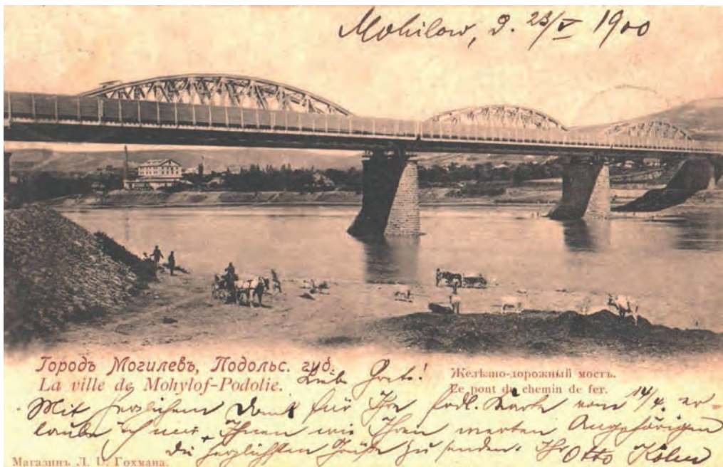
Ілюстр. 11. Залізничний міст у Могилеві-Подільському