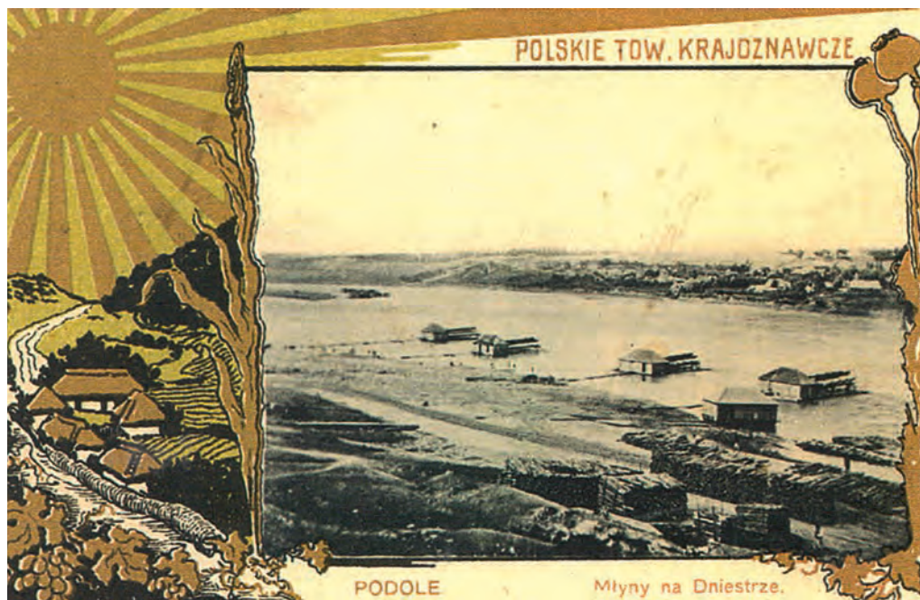
Ілюстр. 5. Млини на Дністрі