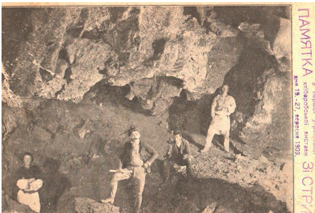
Ілюстр. 12. Печери на околиці с. Кривче