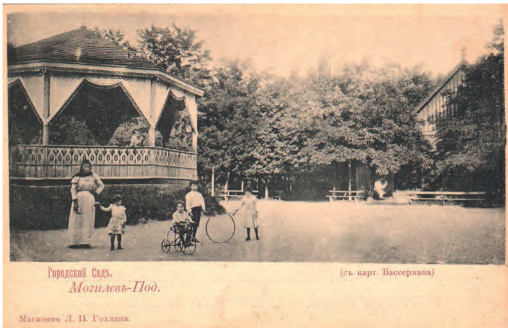
Ілюстр. 9. Миський сад у Могилеві-Подільському