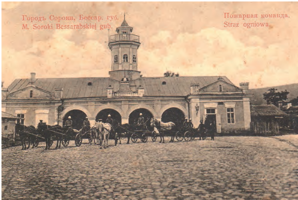
Ілюстр. 3. Пожежна команда м. Сороки Бессарабської губернії