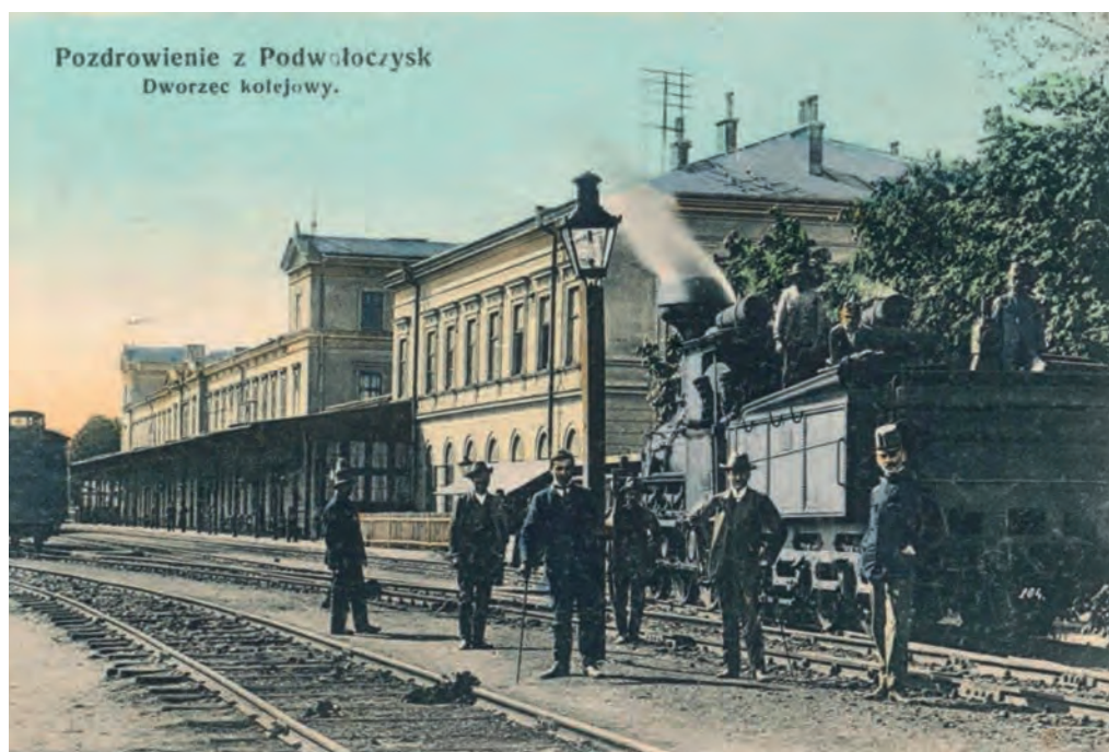
Ілюстр. 10. Залізничний вокзал у Підволочиську