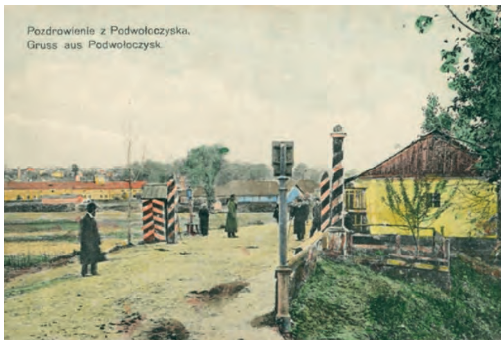
Ілюстр. 2. Прикордонний пункт у Підволочиську