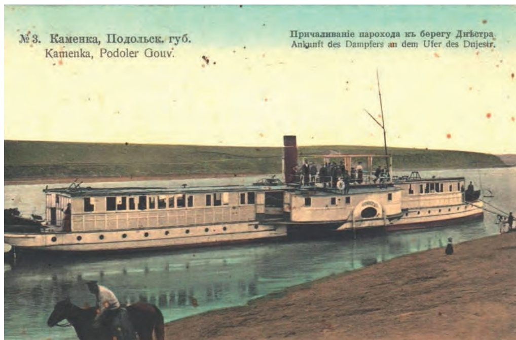
Ілюстр. 6. Причаливання пароплава до берега, м. Кам'янка Подільської губернії