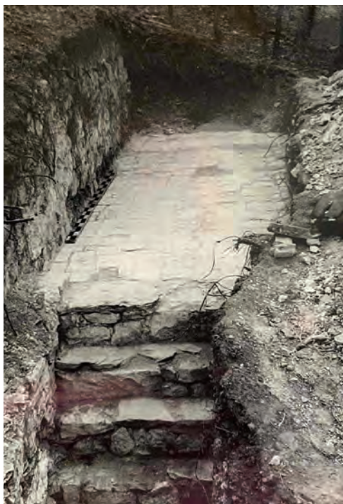
Ілюстр. 5. Сходи та мощення плиткою з вапняку в Бакітському палаці (фото 1963 р.)