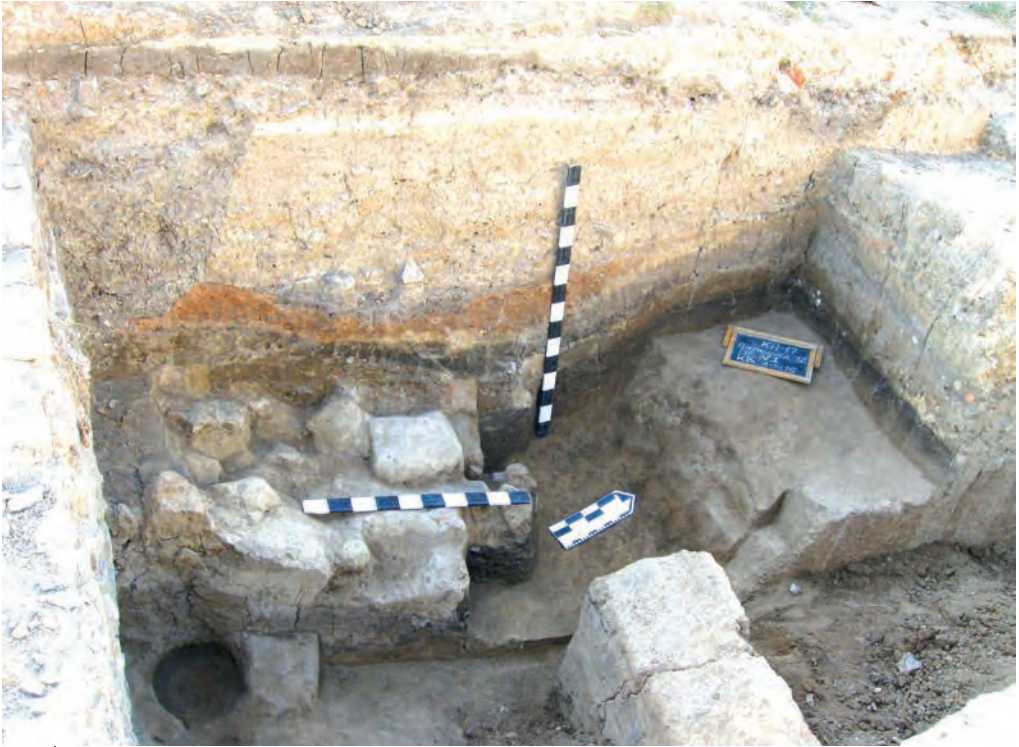
Ілюстр. 2. Залишки валькованого житла по вул. П'ятницькій, 12 у Кам'янці-Подільському