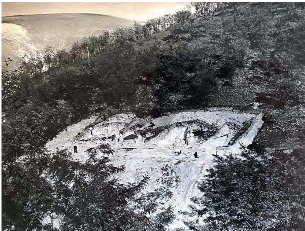
Ілюстр. 4. Початок дослідження палацового комплексу в Бакоті (фото 1964 р.)