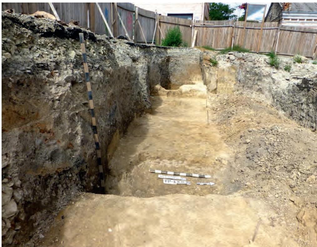
Ілюстр. 12. Залишки житлових об'єктів і гончарного горна з вул. Зарванської, 7/1 у Кам'янці-Подільському