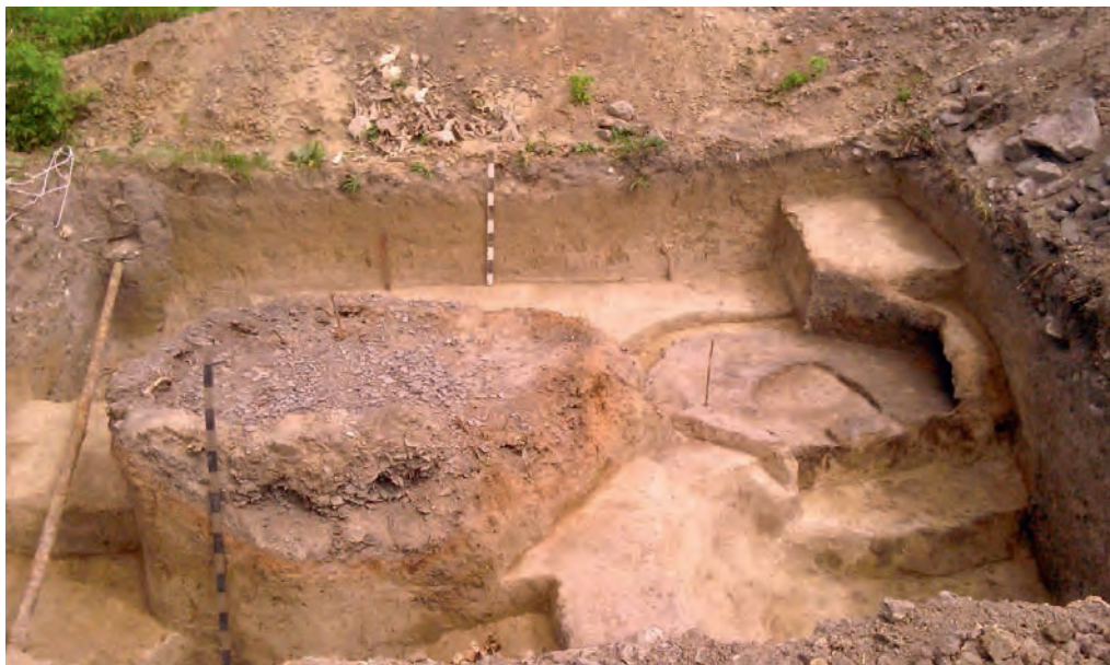
Ілюстр. 11. Залишки гончарного горна з вул. Троїцької, 4а в Кам'янці-Подільському