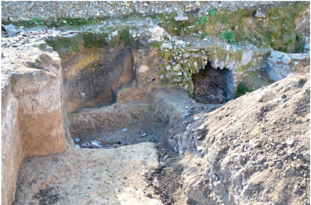
Ілюстр. 1. Залишки житлових об'єктів по вул. Зарванській, 7/1 у Кам'янці-Подільському