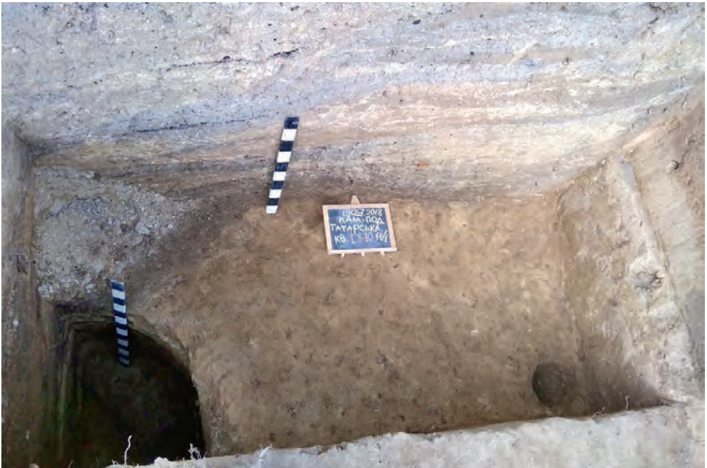
Ілюстр. 3. Залишки житла каркасно-стовпової конструкції та яма-холодня з вул. Татарської, 17/1 у Кам'янці-Подільському