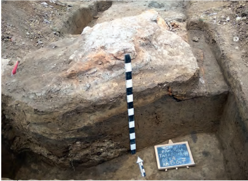
Ілюстр. 13. Залишки гончарного горна з вул. Татарської, 17/1 у Кам'янці-Подільському