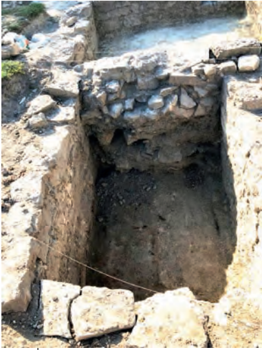
Ілюстр. 7. Склепик Покровської церкви у замку Кам'янця-Подільського