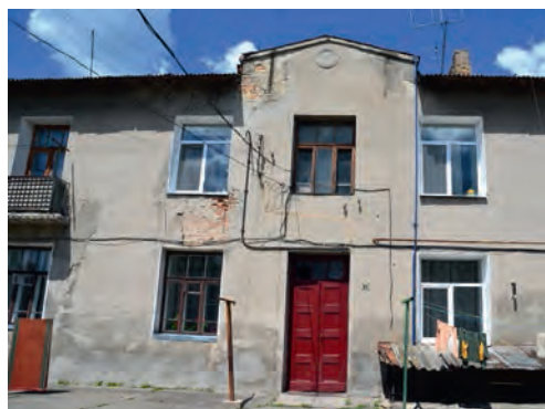
Ілюстр. 6. Колишній вірменський храм у Луцьку (нині це житловий будинок за адресою вул. Галшки Гулевичівни, 12)