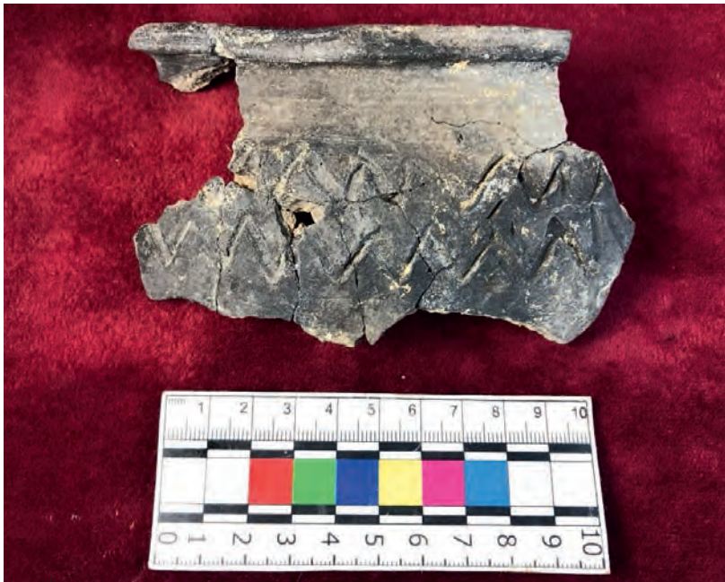
Ілюстр. 14. Фрагмент горщика другої половини XIV ст. з вул. Татарської, 17/1 у Кам'янці-Подільському