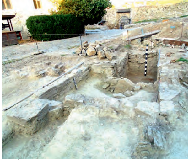
Ілюстр. 8. Залишки фундаментів Покровської церкви у замку Кам'янця-Подільського