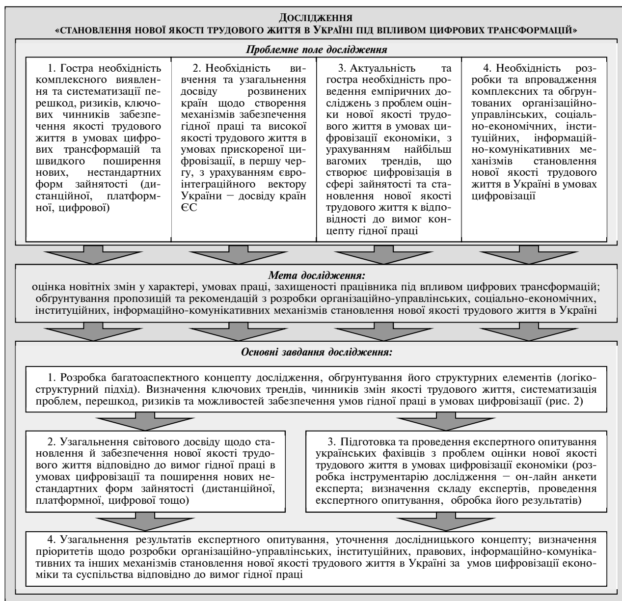
Рис. 1. Постановчі елементи дослідження (проблемне поле – мета – завдання) «Становлення нової якості трудового життя в Україні під впливом цифрових трансформацій»

Зважаючи на зазначене вище, необхідність проведення дослідження щодо проблем та перспектив становлення нової якості трудового життя в Україні можна вважати не просто актуальною, а в певному сенсі – невідкладною. Бо ці питання безпосередньо торкаються проблем розвитку та залучення людського потенціалу, який є найбільшою цінністю та необхідною умовою сталого розвитку в сучасному світі. Ключові структурні елементи такого дослідження наведені на рис. 1.