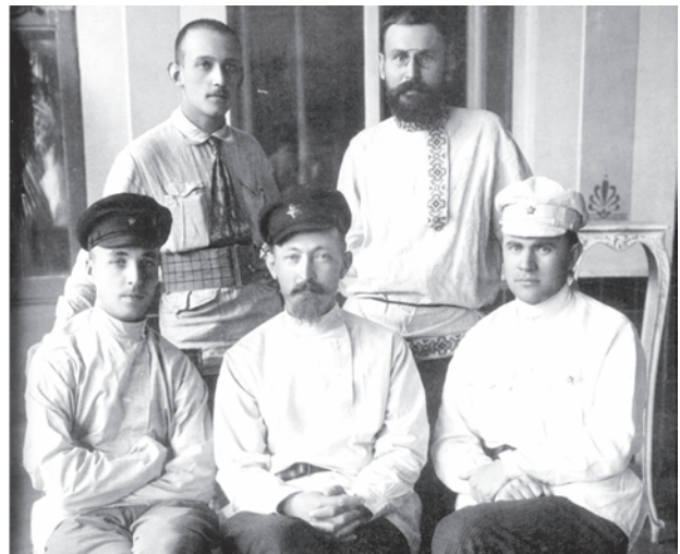
Харків. Літо 1920. Сидять зліва направо: Василь Манцев – начальник ЦУПНАДКОМу, Фелікс Дзержинський, Всеволод Балицький – заступник начальника ЦУПНАДКОМу

Русопятства я не замечал, да и жалоб не слышал. В области моей специальности – здесь обильный урожай. Вся, можно сказать, интеллигенция средняя украинская – это петлюровцы... Громадной помехой в борьбе – отсутствие чекистов-украинцев» 17 (прикметно, що виділені нами слова не увійшли до радянських 18 та сучасних російських видань, присвячених діяльності Ф.Е. Дзержинського 19 ).