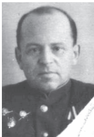
Борис Ізраїльович Борисов-Коган (1950-ті рр.)

Косіора, Павла Постишева. Опираючись на сфальсифіковані матеріали попереднього слідства за участі С Брука та його колег з секретно-політичного відділу Військова колегія Верховного суду СРСР 21 жовтня 1936 р. засудила до розстрілу 37 осіб, більшість з яких були викладачі українських вузів та наукові співробітники Всеукраїнської асоціації марксистсько-ленінських інститутів (ВУАМЛІН) та АН УСРР. Серед них: професор фізики Київського університету Лев Штрум; професор кафедри стародавньої історії Київського університету (1930-1936) Григорій Лозовик 62 ; викладач історії в Київському педінституті ім. О.М. Горького Лев Сахновський 63 ; філософ Яків Розанов (у 1922-1928 рр. завідувач Київською Центральною Робітничою бібліотекою ім. ВКП(б)); викладач діамату у Київському лісотехнічному інституті в 1931-1934 роках Гнат Звада 64 , професор математики Київського університету, доктор фізико-математичних наук, член-кореспондент АН Української СРР Михайло Орлов та ін. Як свідчать архівні документи Соломон Брук в якості помічника начальника СПВ УДБ НКВС УСРР був присутній в ніч на 22 жовтня 1936 року у спецкорпусі внутрішньої тюрми НКВС УСРР під час процедури умирення педагогічних працівників та вчех і своїм підписом засвідчив акт розстрілу 37 учасників української троцькістсько-націоналістичної бойової організації.