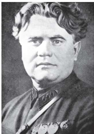
Всеволод Аполлонович Балицький (1932 р.)

Ймовірно Соломон Брук зробив певні висновки оскільки в черговій характеристиці на-