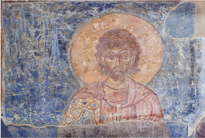
Рис. 1. Невідомий святий. Фреска XII ст. Південна площина південно-західного підкупольного стовпа Кирилівської церкви.

лівською церквою свідчать, що в XVII ст. фресковий живопис був частково поновлений, і з'явилися лише окремі темперні зображення. Повністю потиньковано й забілено фресковий живопис пам'ятки було в XVIII ст. Прикро, що автор не знається на справжніх широківідомих, навіть азбучних, істинах щодо історії пам'ятки.