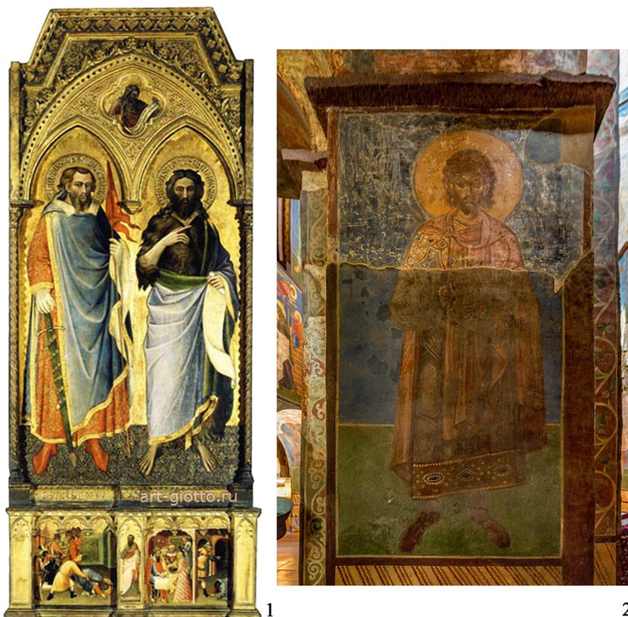
Рис. 3. 1 – Спінелло Аретіно. Ікона «Святі Немезій і Йоан Предтеча». Дерево, темпера. 1385 р. Музей образотворчих мистецтв. Будапешт; 2 – Невідомий святий. Фреска XII ст. (вгорі), олійний живопис XIX ст. (внизу). Південна площа південно-західного опорного стовпа Кирилівської церкви.