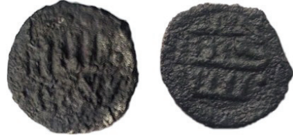
Мал. 1.1.а. Наслідування дангу Джанібека, Гюлістан 753 р. Х. (фото)