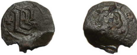
Мал. 1.2. Геллер Анни Рацибузької (1380–1405)