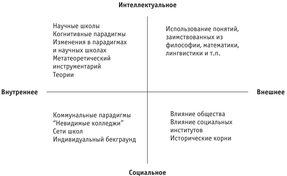
Рис. 3. Главные подтипы метатеории как средства достижения более глубокого понимания теории [Ritzer, 1988: p. 190]

Учитывая предметное разнообразие этого типа метатеоретизирования, Ритцер дифференцировал его на 4 подтипа. Основой дифференциации стала кросстабуляция двух концептуальных дихотомий или измерений “внутреннее — внешнее” и “интеллектуальное — социальное” (рис. 3).