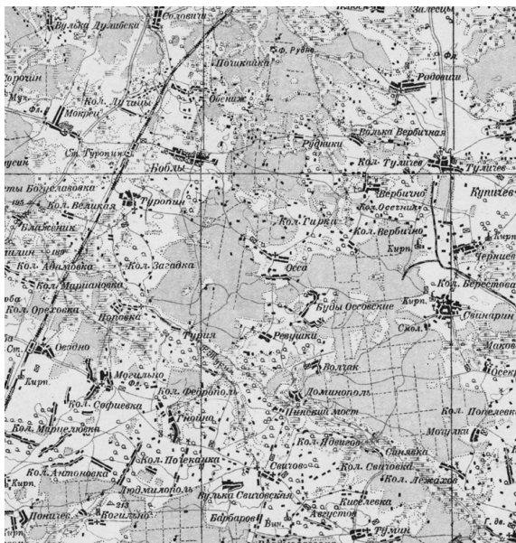
Місцевість у районі Свинаринського лісового масиву, де розташовувалася «Січ». Фрагмент радянської топографічної мапи 1931 р.

26 січня о 16.00 партизани вийшли зі с. Мосур в напрямку залізниці Володимир-Волинський — Ковель, яку вночі з боєм перейшли біля с. Чорний Ліс. Далі 2-й стрілецький батальйон (СБ) майора Петра Кульбаки спрямував свій удар на с. Осу й Буди-Осо-