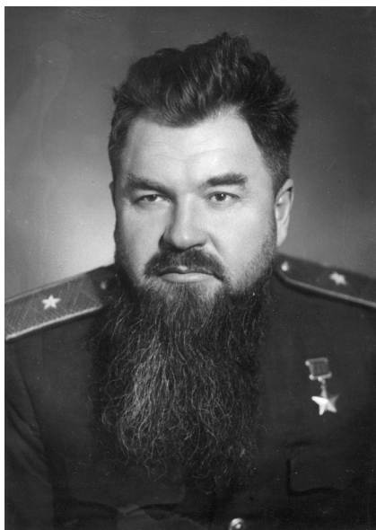
Командир Сумського партизанського з'єднання Петро Вершигора.

20 січня 1944 р. партизани досягли с. Мосур нині Мосир Любомльського р-ну, яке лежало на північний захід від повстанської бази «Січ» у Свинаринських лісах, і розташувалися там на відпочинок. Цікаво, що серед причин, які зумовили потребу довшого постою в Мосурі (передішка, реорганізація, розвідка тощо), Вер-