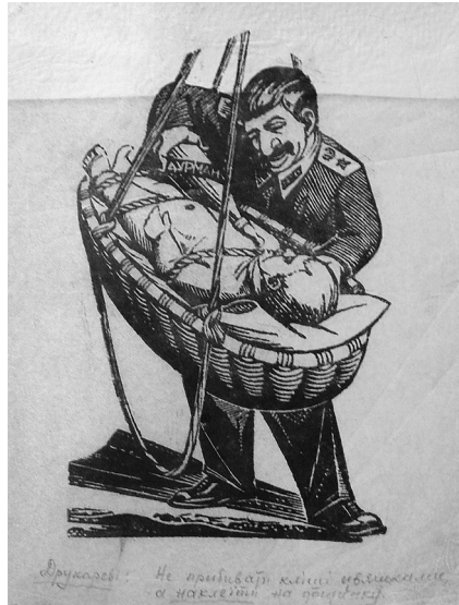
Отрують з дитинства.

Зазначимо, що колекція матеріалів головного художника українського повстанського руху у фондозбірні Національ-