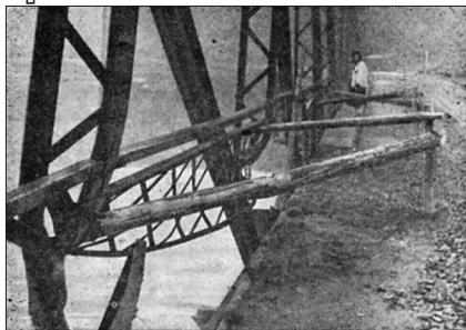
Міст на Чорній ріці біля Торуня, підірваний польськими терористами

оснащених на військовий лад, які мають засилати в Карпатську Україну» 48 .