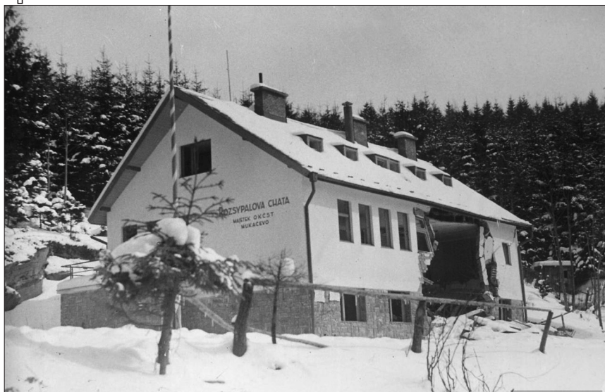
Туристична база «Розсипалова хата» у с. Скотарське на Волівеччині, підірвана внаслідок диверсії польських бойовиків, грудень 1938 р.

ку 1939 р. його змінив П. Курницький). Попри відмову Будапешта пристати на цей план, Варшава не могла, склавши руки, просто пасивно спостерігати за подіями на Підкарпатті. У польському зовнішньополітичному відомстві вважали, що якщо Угорщина не проявить рішучості в карпатоукраїнському питанні з огляду на позицію Берліна, то Польща сама приступить до його вирішення.