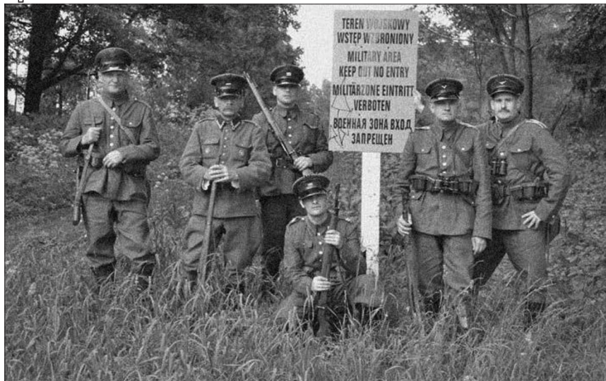
Військовослужбовці польського Корпусу охорони прикордоння, 1938 р.