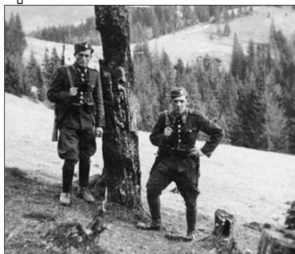
Чехословацькі прикордонники в Карпатах, 1938 р.

ження з угорською стороною в питанні проведення диверсійної акції у Карпатській Україні не принесли жодних успіхів, а ставлення до планів польського консульства в Севлюші було однозначно негативним. «В країні [Карпатській Україні — О. П.] не існує організованої опозиції... Праця в терені опирається тільки на оплачених агентів і набагато перевищує їх можливості. У зв'язку з цим польські плани щодо створення спільного кордону з Угорщиною шляхом проведення спільної диверсійної акції проти Чехословаччини зазнали краху» 77 .