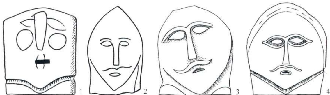
Рис. 2. Искажения в изображении лиц на изваяниях погрудного типа (по: Чариков А.А., 1986, с.95, рис.4, 6, 12, 13, 14).

Особенности проработки головы у придороженского изваяния свидетельствуют о том, что ваятель не ставил себе целью выделить ее из монолита камня, хотя материал (песчаник), в отличие от гранита 3 , позволял это сделать без