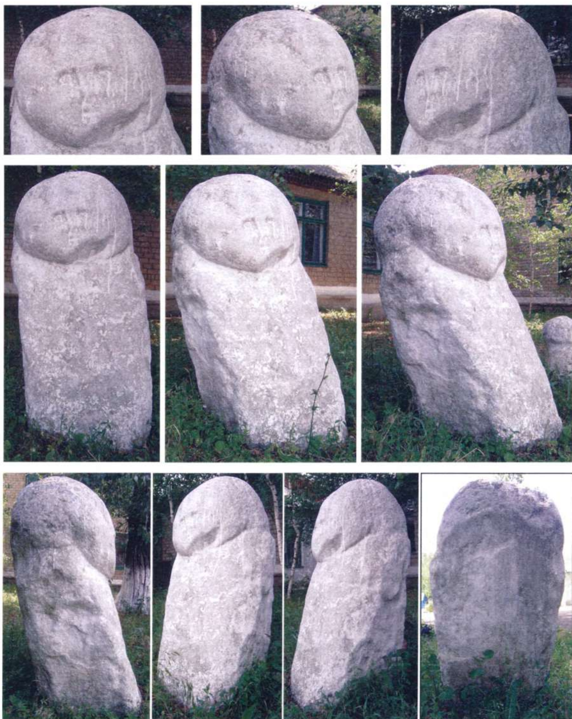
Рис. 1. Изваяние из с.Придорожное. Fig. 1. The statue from Pridorozhnoie village